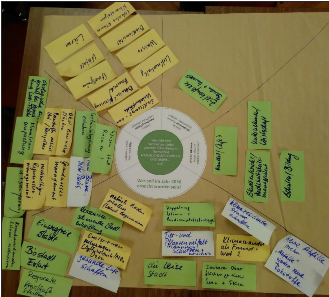
Abbildung 1: Themenfeld "Natürliche Ressourcen und Umwelt"