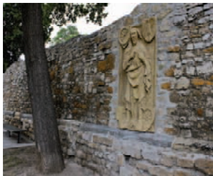
Johannesmauer mit Johannesrelief

Übergabe des Johannesreliefs an der Johannesmauer mit Bläsermusik 12-14 Uhr Turmaufstieg Ort: Johannesmauer (Ecke Johannesstr./J.-Gagarin-Ring)