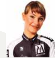
Bahnradsprinterin Kristina Vogel Junioren-Weltmeisterin Deutsche Meisterin

„Ich war schon immer Sportbegeistert, bis ich im Jahr 2000 meinen Sport gefunden habe: Radfahren! Damit habe ich mein Hobby zum Beruf gemacht. Olympia 2012 in London, das ist mein Ziel!“