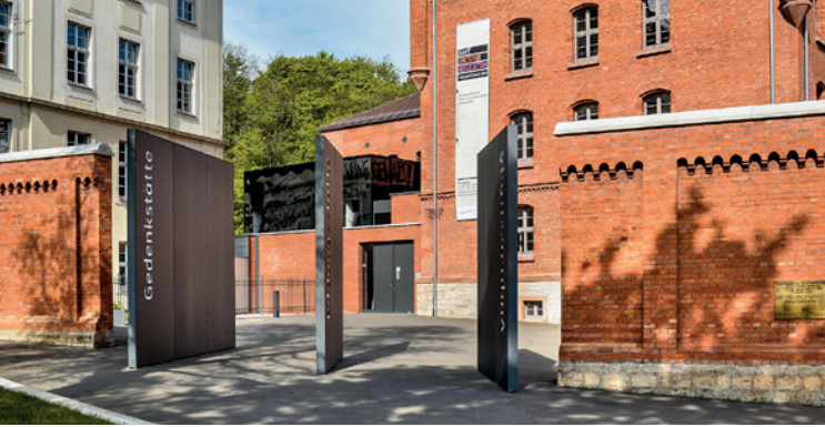
Eingang der Gedenk- und Bildungsstätte Andreasstraße