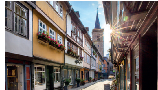
Blick auf die Ägidienkirche