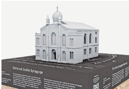
Darstellung Tastmodell Große Synagoge

📍 360Grad Thüringen Digital Entdecken, Willy-Brandt-Platz 1