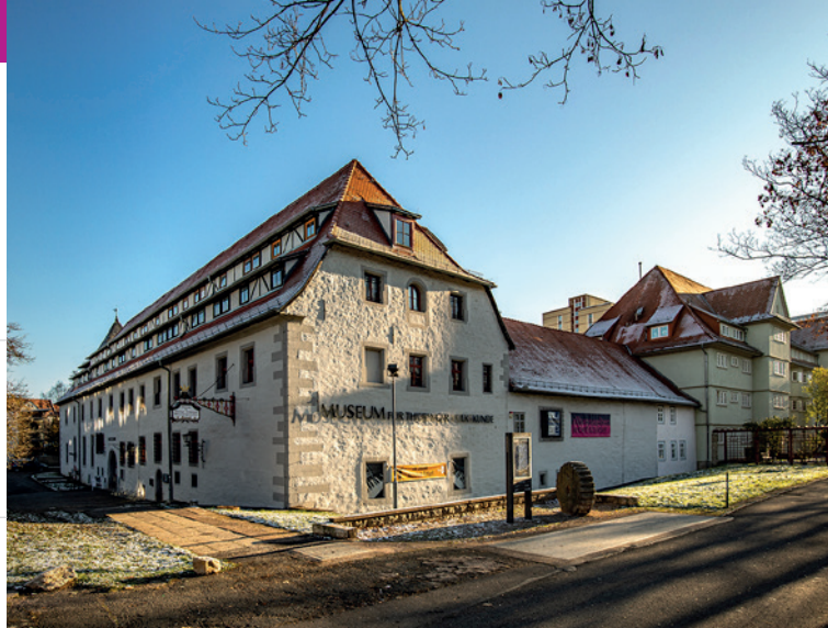
Blick auf das Denkmal Großes Hospital