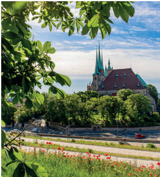
Dom St. Marien

15:00 Führung in der neuen Domschatzkammer ⓘ Kosten 5,50 € p. P., Anmeldung erforderlich, Tel. 0361 6461265 📍 Domberg