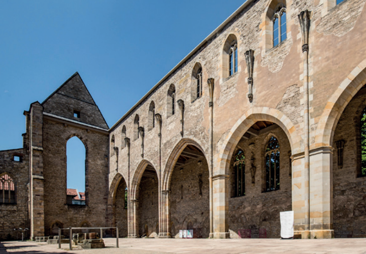
Hoher Chor der Barfüßerkirche

15:00 – 18:00 Denkmal Hoher Chor der Barfüßerkirche zu Erfurt Besichtigung und Ausstellung „Von Feininger zum Totentanz. Fotoarbeiten von Aribert Janus Spiegler“