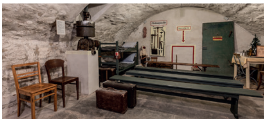
Blick in den Luftschutzkeller

15:00 – 18:00 Denkmal Luftschutzkeller Erläuterungen durch Harald Baum ⓘ zugänglich vom Innenhofbereich 📍 Personalamt, Durchgang in den Wigbertihof, Barfüßerstraße 17b