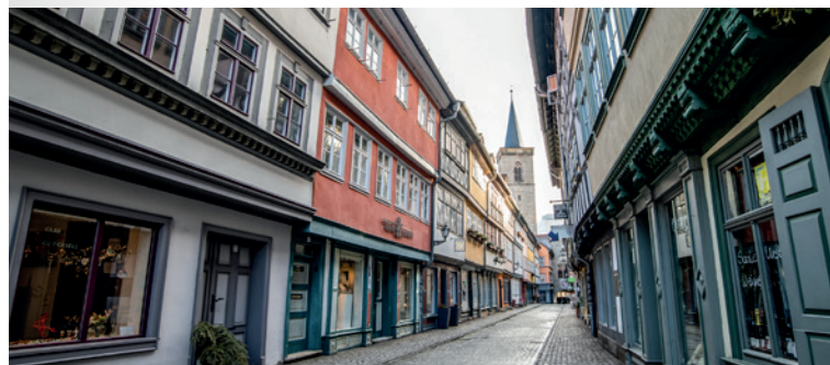
Blick auf die Krämerbrücke