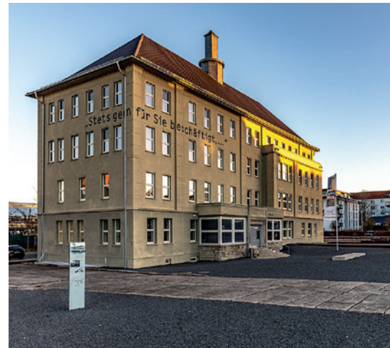
Erinnerungsort Topf & Söhne