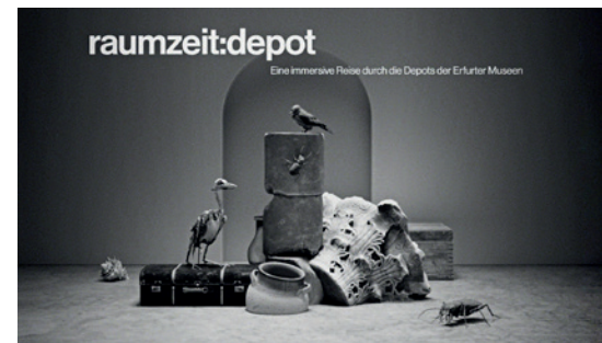
Die Installation nimmt die Depotsituation der Erfurter Museen in den Fokus.