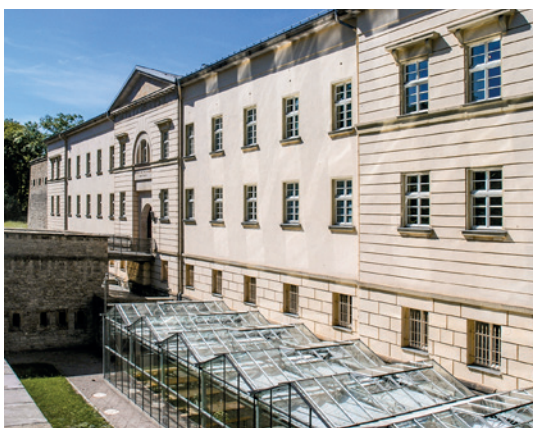
Blick auf Cyriaksburg und Gewächshaus des Deutschen Gartenbaumuseums

11:00 und 13:30 Denkmal Haus „Zum Güldenen Rade“ Führung im ZDF Landesstudio Thüringen