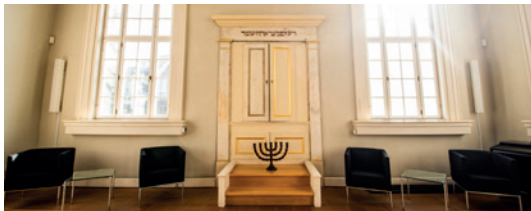
Der Betsaal in der Kleinen Synagoge

17:00 – 20:00 Denkmal Kleine Synagoge Erzählcafé „Hören, wie es früher einmal war“ für alle mit Erinnerungen an Alte und Kleine Synagoge in der Zeit vor der Einrichtung der Museen 📍 An der Stadtmünze 4