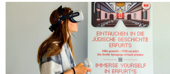
Große Synagoge mit VR-Brille erleben

📍 360Grad Thüringen Digital Entdecken, Willy-Brandt-Platz 1