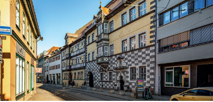
Stadtmuseum „Haus zum Stockfisch“