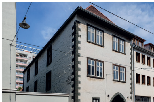
Haus „Zur Mühlhaue“

📍 Johannesstraße 166 (Eingang hofseitig)