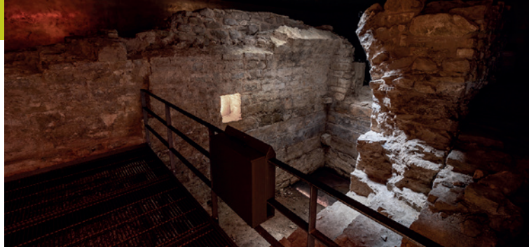
Blick in die Mikwe