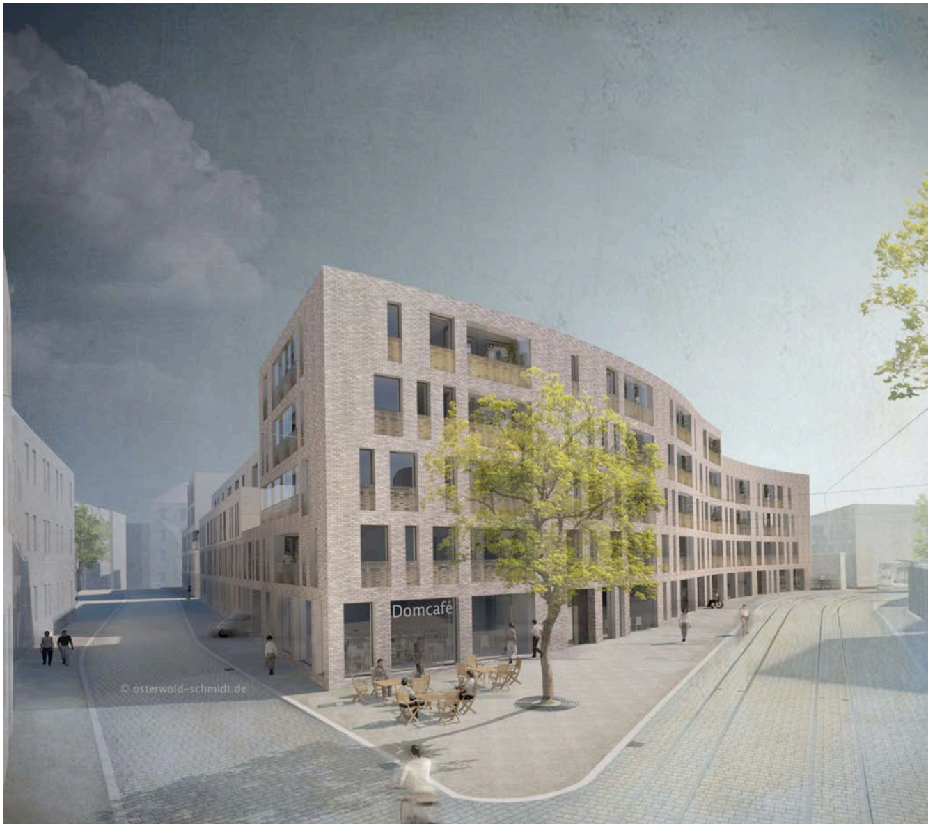
Blick vom Domplatz (Nord-Ost)