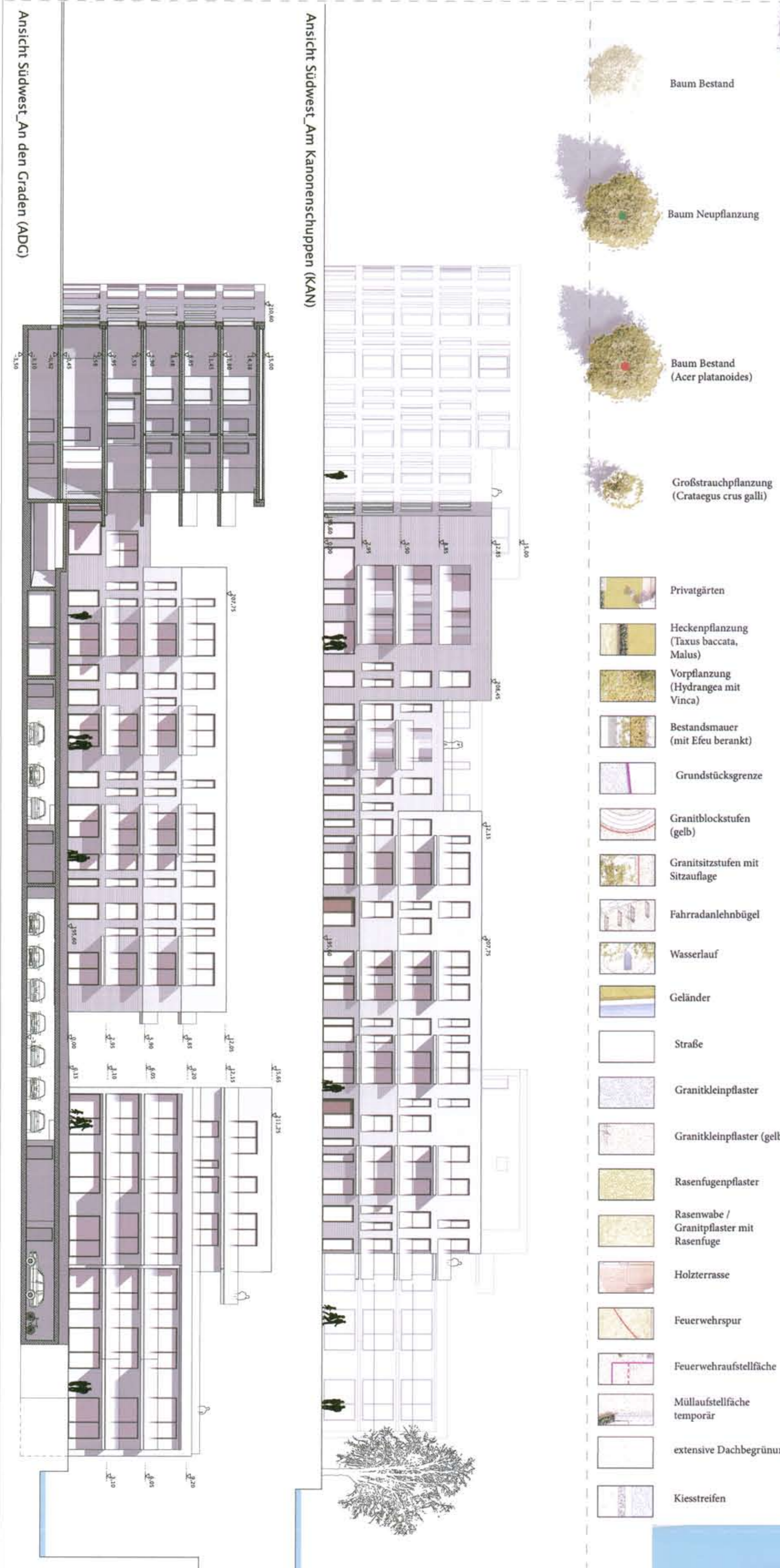
Ansicht Südwest_An den Graden (ADG)