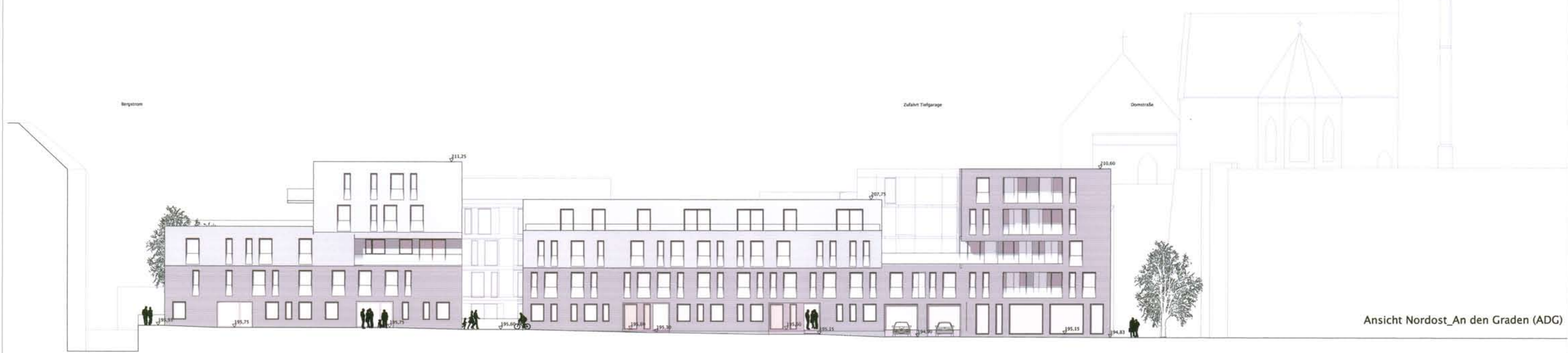
Ansicht Nordost_An den Graden (ADG)