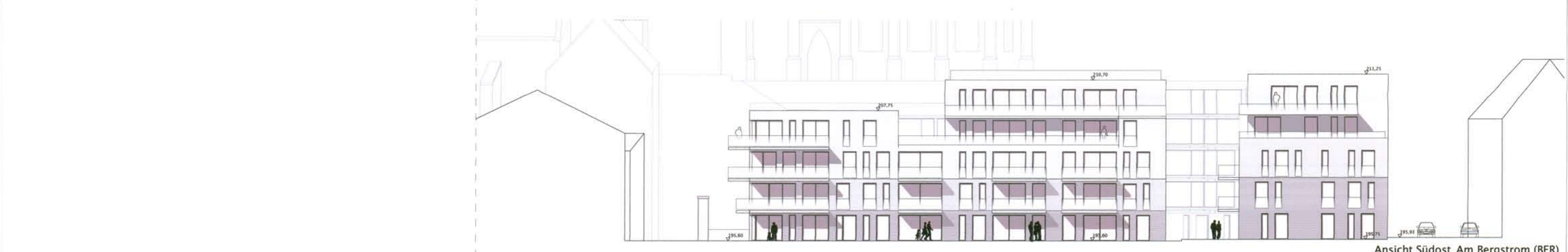
Ansicht Südost_Am Bergstrom (BER)