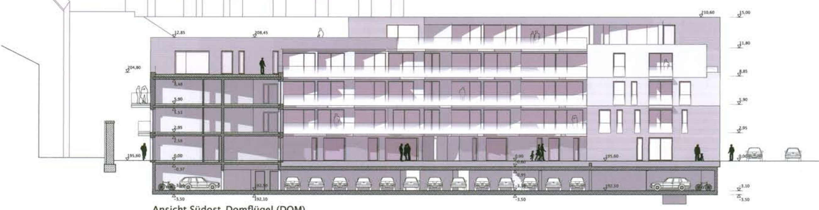
Ansicht Südost_Domflügel (DOM)