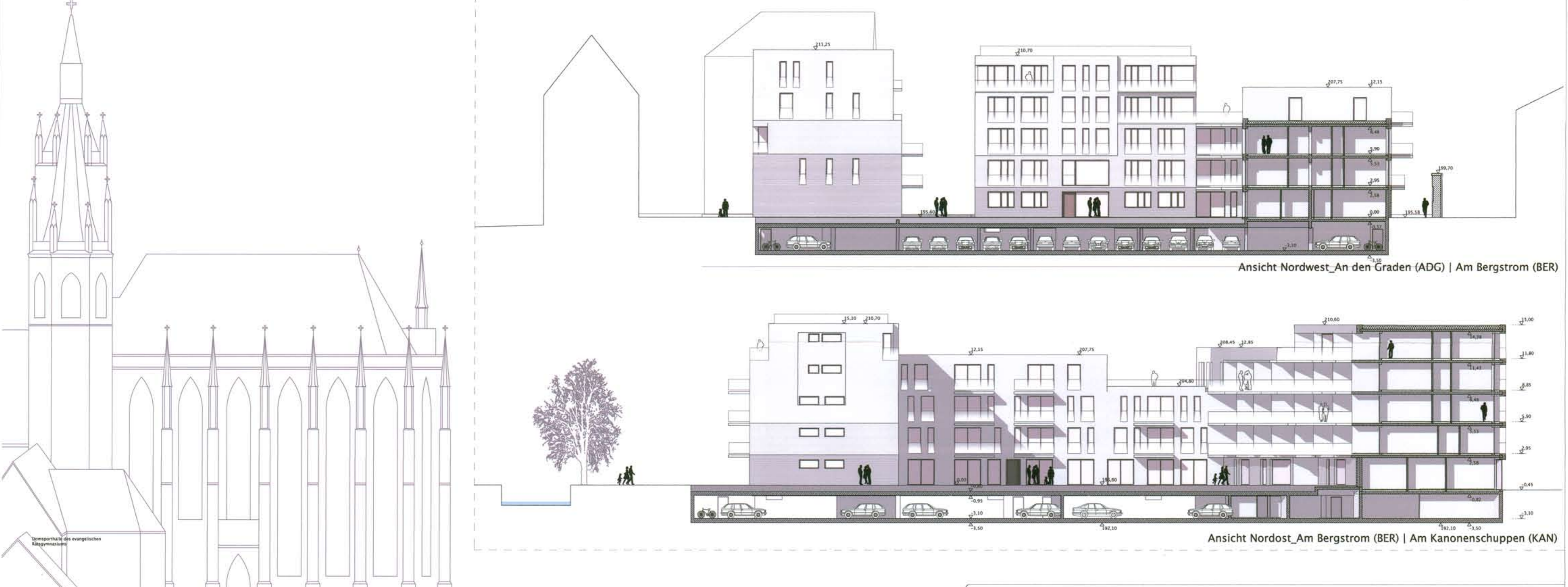
Ansicht Nordwest_An den Graden (ADG) | Am Bergstrom (BER)