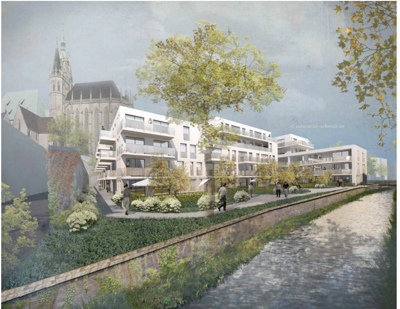
Blick vom Bergstrom (Süd-West)