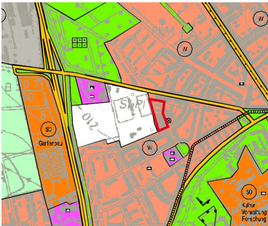
Abbildung 2: Auszug aus dem wirksamen Flächennutzungsplan der Stadt Erfurt (ohne Maßstab)