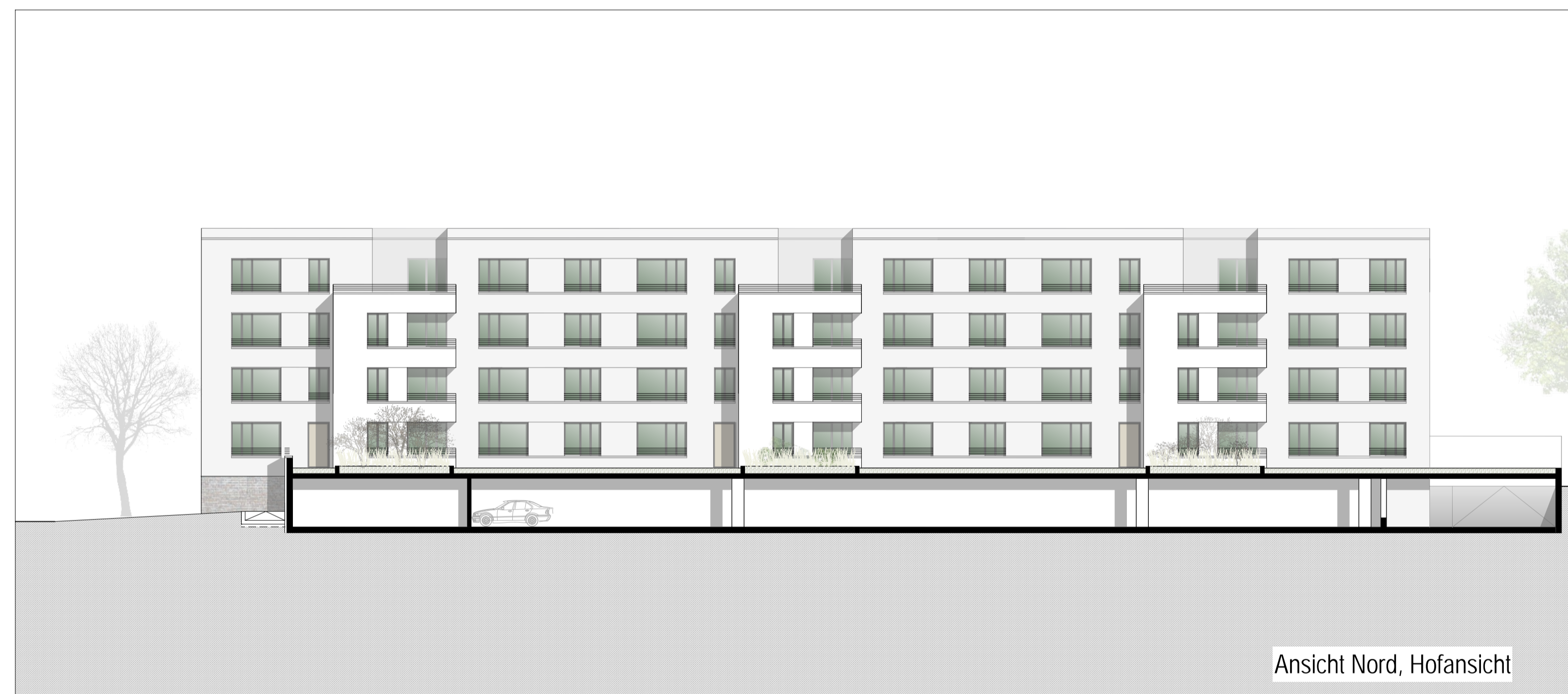
Ansicht Nord, Hofansicht