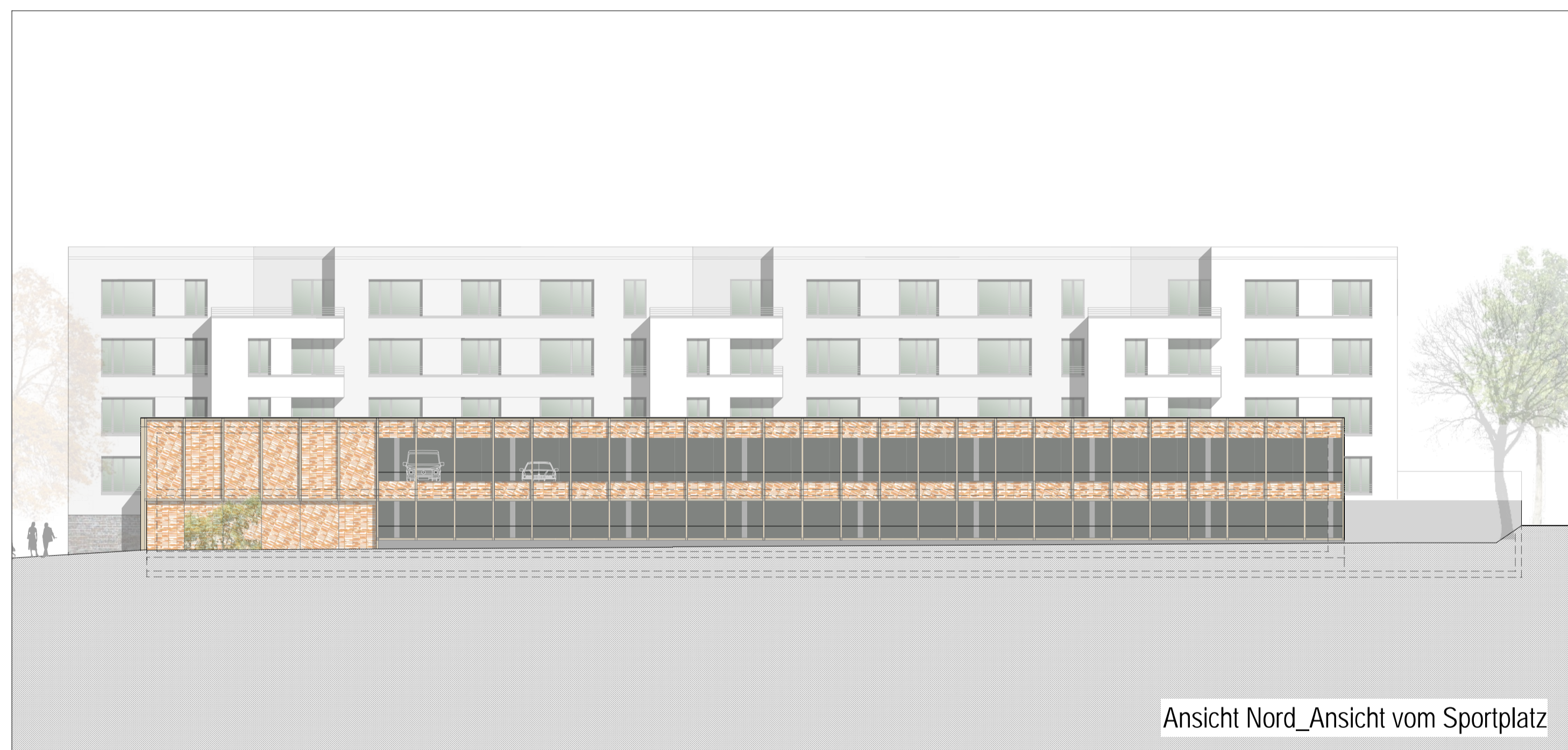
Ansicht Nord_Ansicht vom Sportplatz