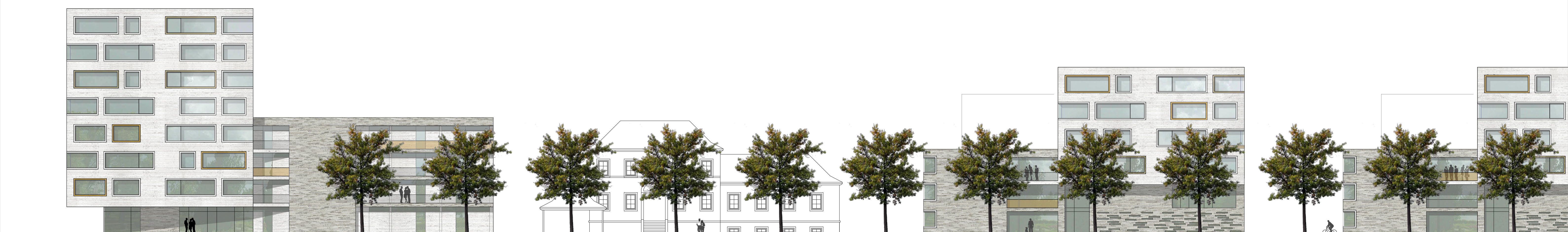
Ansicht Ost / Promenadenweg M 1:200