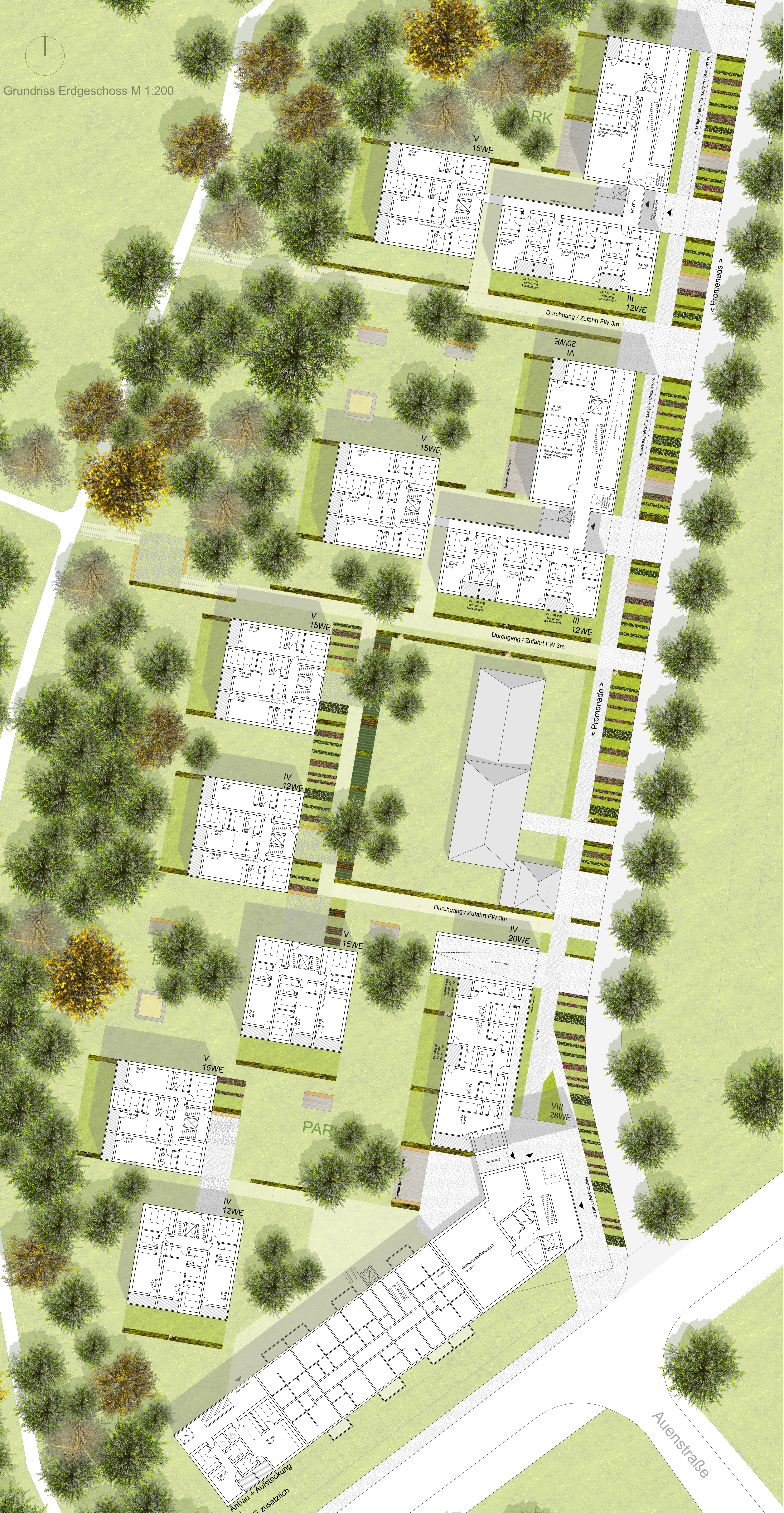
Grundriss Erdgeschoss M 1:200