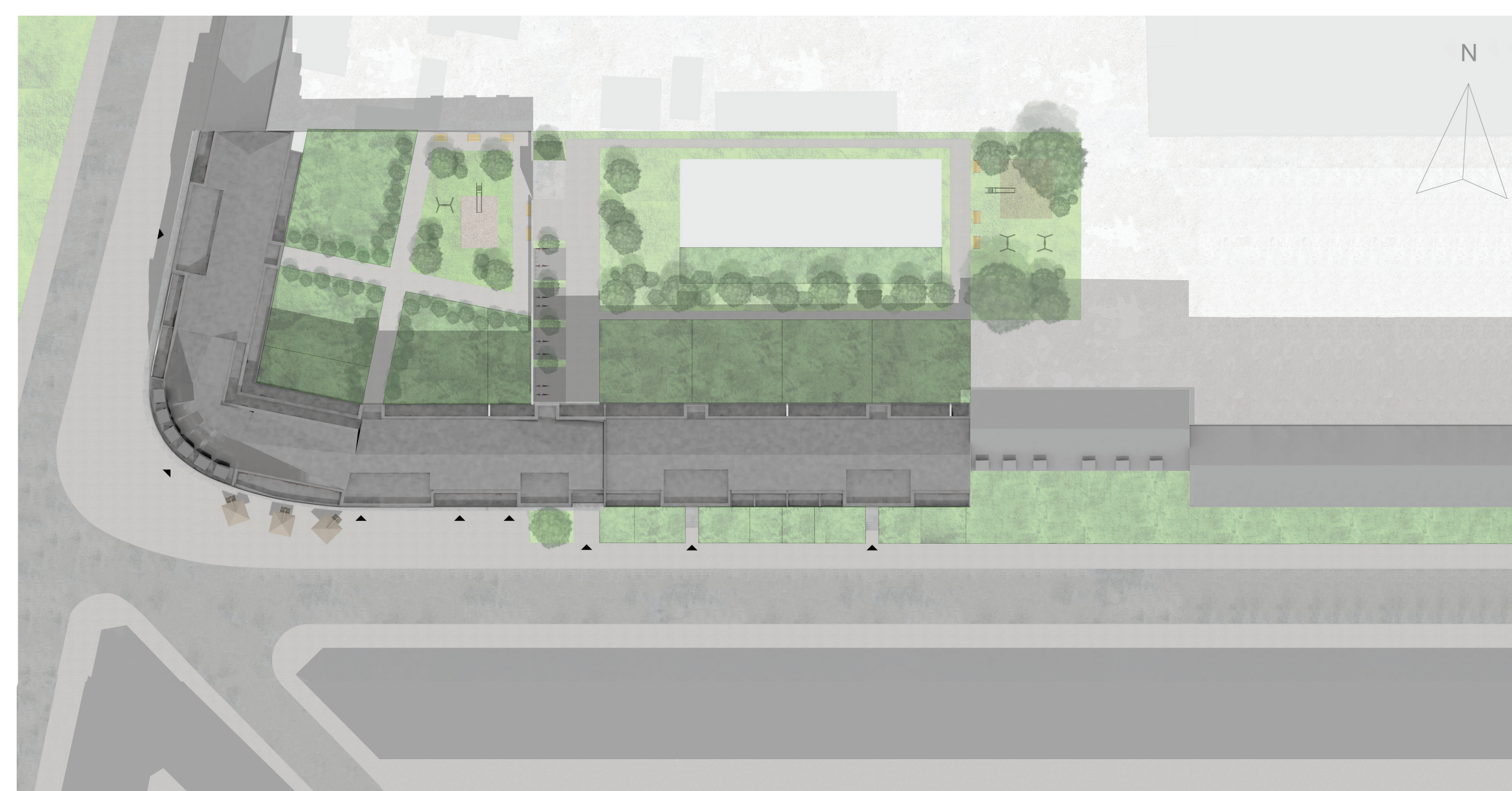
Lageplan mit Dachaufsicht M 1:500