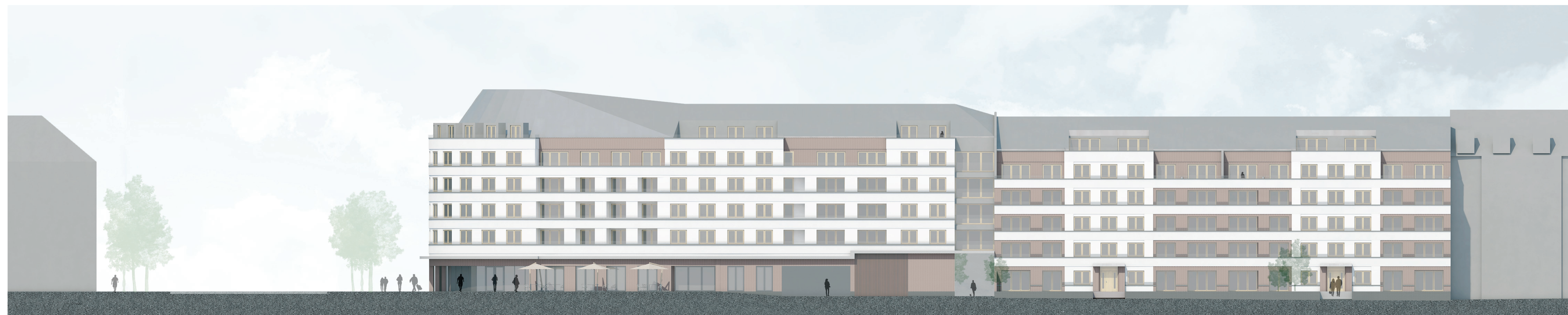
Ansicht Süd M 1:200