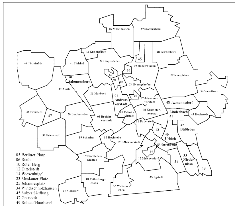
Anlage 4 zur 27. Satzung zur Änderung der Hauptsatzung vom 23. April 2001 – Stadtteile der Landeshauptstadt Erfurt