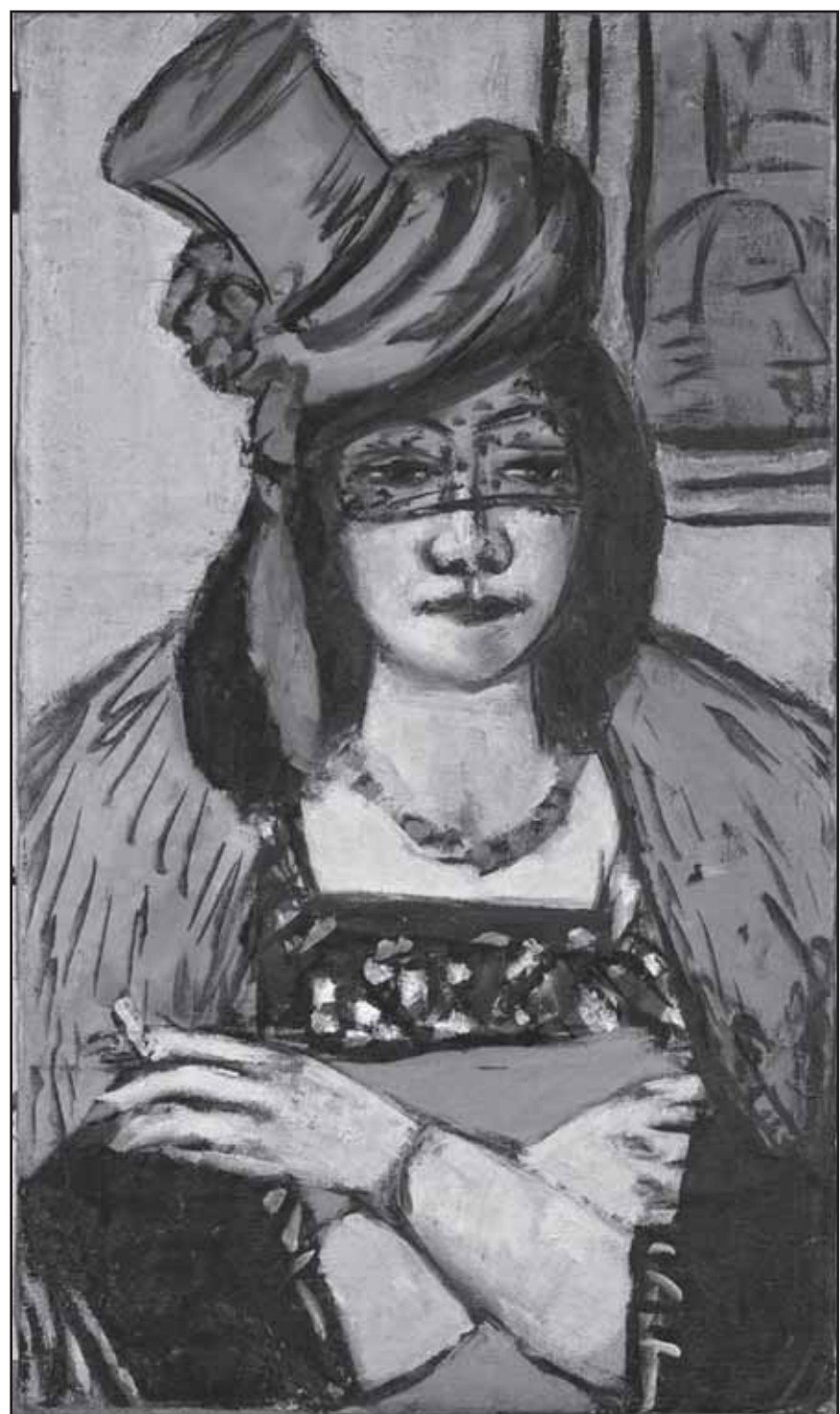
„Max Beckmann, Dame mit Hut und Schleier, 1941, Öl auf Leinwand“

Die Ausstellung „Von Renoir bis Feininger“ - Werke der klassischen Moderne aus dem Karl Ernst Osthaus Museum Hagen bietet bis 9. September 2007 die Kunsthalle Erfurt auf dem Fischmarkt