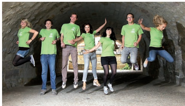
Die sieben Tutoren freuen sich auf den Start der 8. Internationalen Summer School, (Foto: Philipp Paul).

Hierfür bietet die Fachhochschule umfangreiche Vorträge deutscher und internationaler Dozenten sowie mehrere Exkursionen zu Thüringer Firmen und in die Umgebung. Geplant ist zum Beispiel ein Besuch des Eissportzentrums Erfurt und des Golf Resorts Blankenhain, und in der DKB Skihalle wird außerdem der ein oder andere Student mit Sicherheit große Augen bekommen, wenn er zum ersten Mal in seinem Leben Schnee