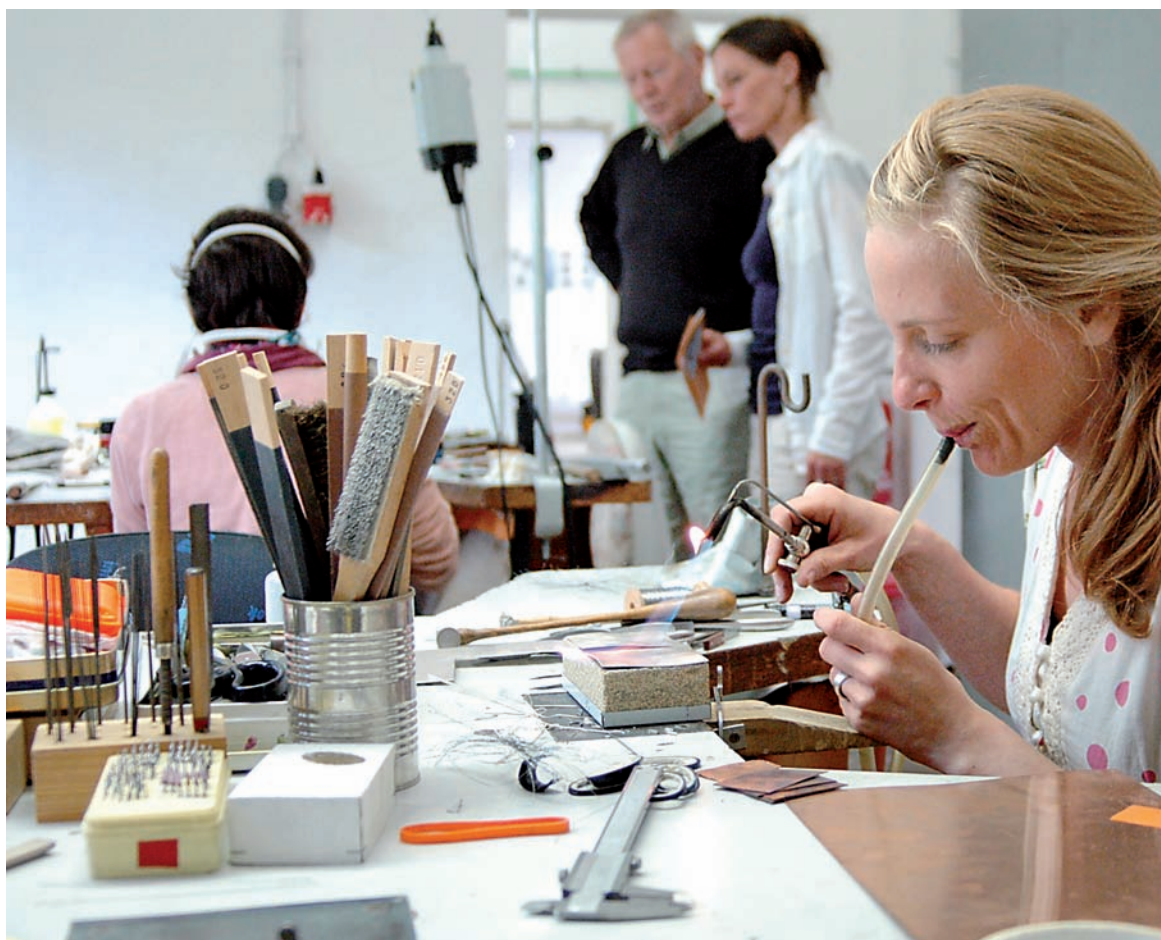
Filigrane Arbeit: Beim 14. Erfurter Schmucksymposium kamen Präzisionswerkzeuge ebenso zum Einsatz wie unterschiedlichste Materialien und Verarbeitungstechniken.