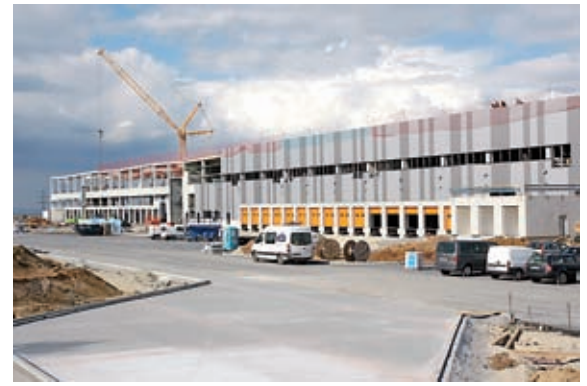
Schrei vor Glück: Von der Grundsteinlegung am 8. Dezember 2012 (Bild links) bis zum Versand des ersten Paketes (Bild Mitte) verging gerade mal ein Jahr.