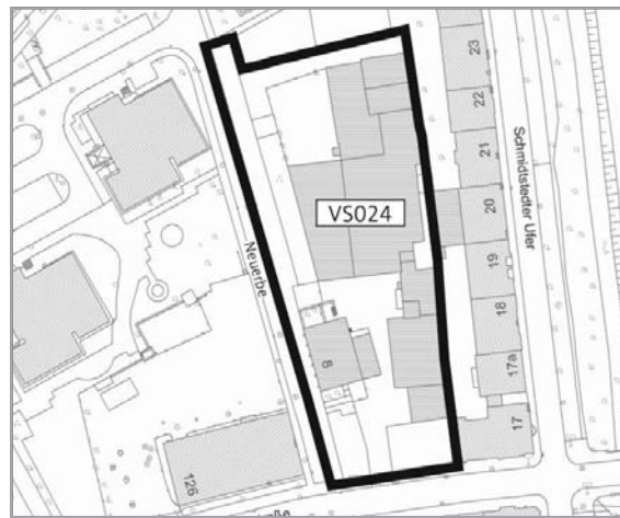
Zur Drucksachen-Nr. 2447/12

gez. Bausewein A. Bausewein Oberbürgermeister