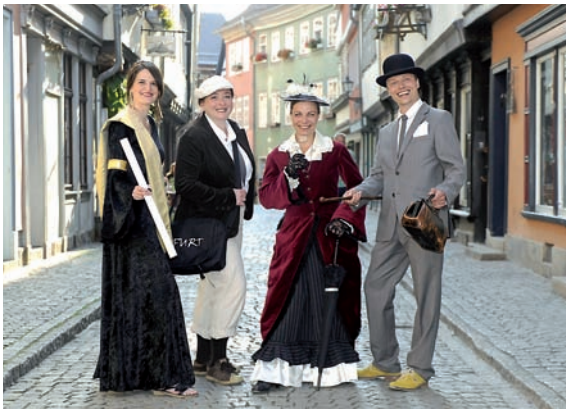
Machen neugierig: Gästeführer in historischen Gewändern.