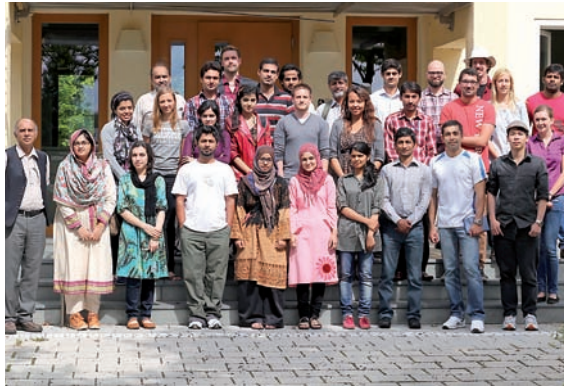
Erfurt heißt alle Besucher und Studierende herzlich willkommen und wünscht viel Spaß dabei, die Stadt zu erkunden.

Angehende Akademiker aus den USA, Indien, Indonesien, Russland, der Ukraine und dem Iran befassen sich noch bis zum 7. September mit dem Thema der internationalen Marketingstrategie für Tourismus in Thüringen.