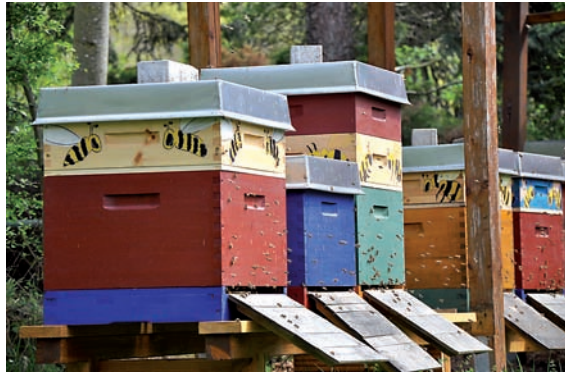
Die Bienenwohnungen auf der Fuchsfarm – geräumig und farbenfroh.

tischen imkerlichen Dingen werden vielfältige Aktivitäten zum Insekten- und Bienenschutz bzw. zur Artenvielfalt entwickelt. Beispiele dafür sind die Betreuung einer Masterarbeit zur Behandlung der Honigbiene im Unterricht an Grundschulen, Bau und Anlage von Gründächern als Beitrag zum Umwelt- und Artenschutz oder die Öffentlichkeitsarbeit für Artenvielfalt, Bienen und Imkerei.