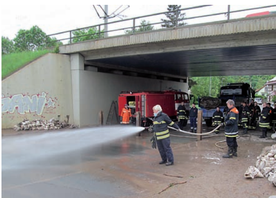
Das Hochwasser in Erfurt im vergangenen Jahr – zahlreiche Ehrenamtliche waren im Einsatz, um der Naturgewalt Einhalt zu gebieten, Schäden zu bekämpfen und Schlimmeres zu vermeiden.

Der Tag wird für die Geehrten mit einem Besuch im Theater Erfurt ausklingen.