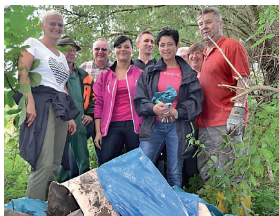
Auch im Umweltbereich ist Ehrenamt gefragt. So wie hier zum Freiwillingentag am Samstag bei der Uferfege an der Geraaue.