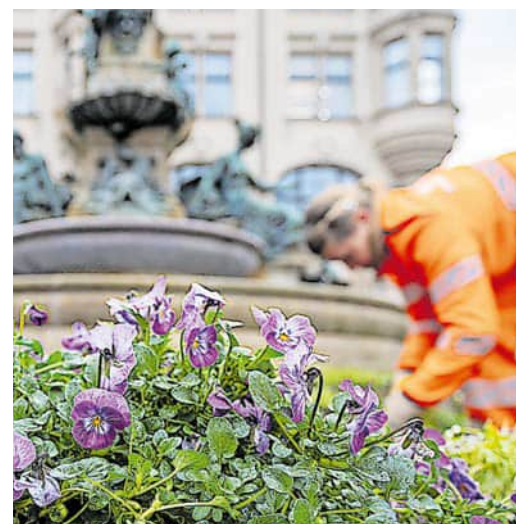
Wie hier am Angerbrunnen werden die Wechselblorbeete von den Mitarbeitenden des Garten- und Friedhofsamtes bepflanz.

Die Wechselblorflächen am Karl-Marx-Platz und am Sorgebrunnen im Stadtpark werden vom erfolgreichen Landschaftsarchitekten und Pflanz-