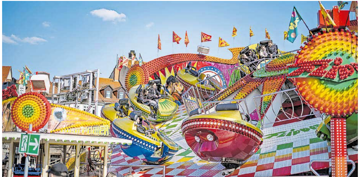
Von familienfreundlich bis Nervenkitzel pur: Auf dem Altstadtfrühling findet jeder das passende Fahrgeschäft.

Offiziell eröffnet wird der Erfurter Altstadtfrühling am Samstag, dem 30. März, um 15:00 Uhr im Eingangsbereich des Domplatzes gegenüber der Marktstraße. Bereits am Donnerstag, dem 28. März 2024, findet um