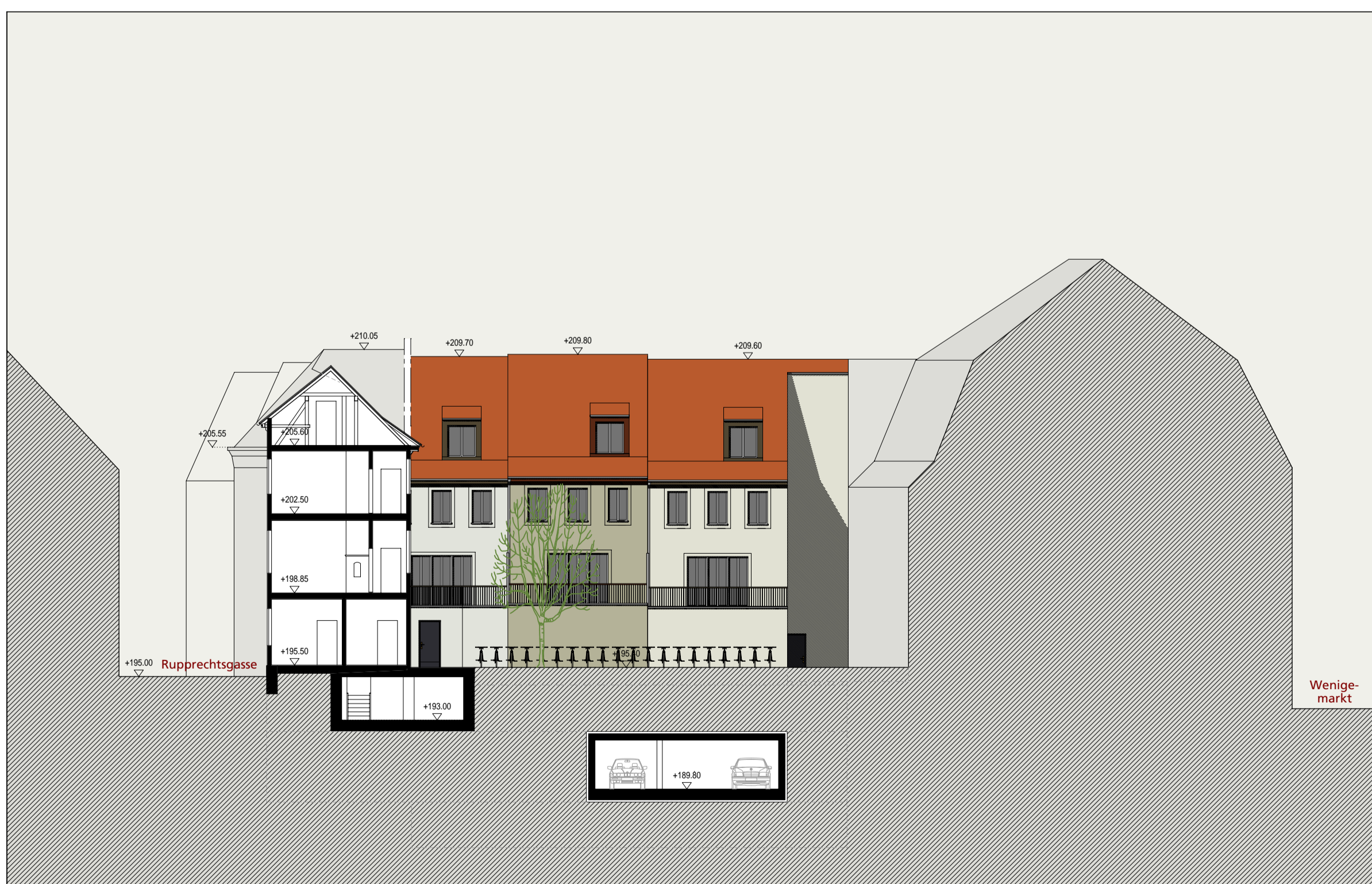
Schnitt B-B 1:200