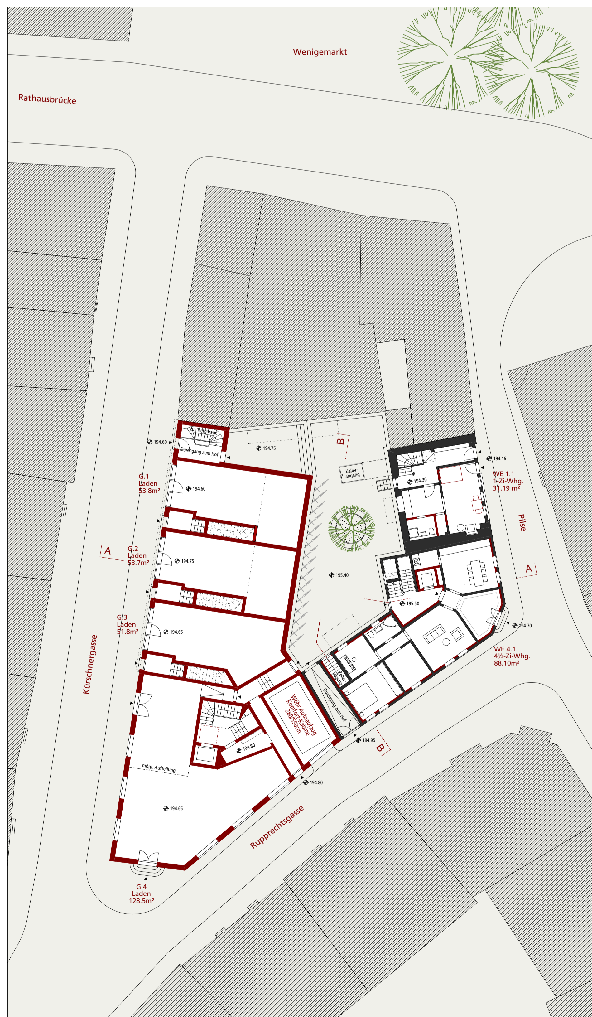
Grundriss EG 1:200