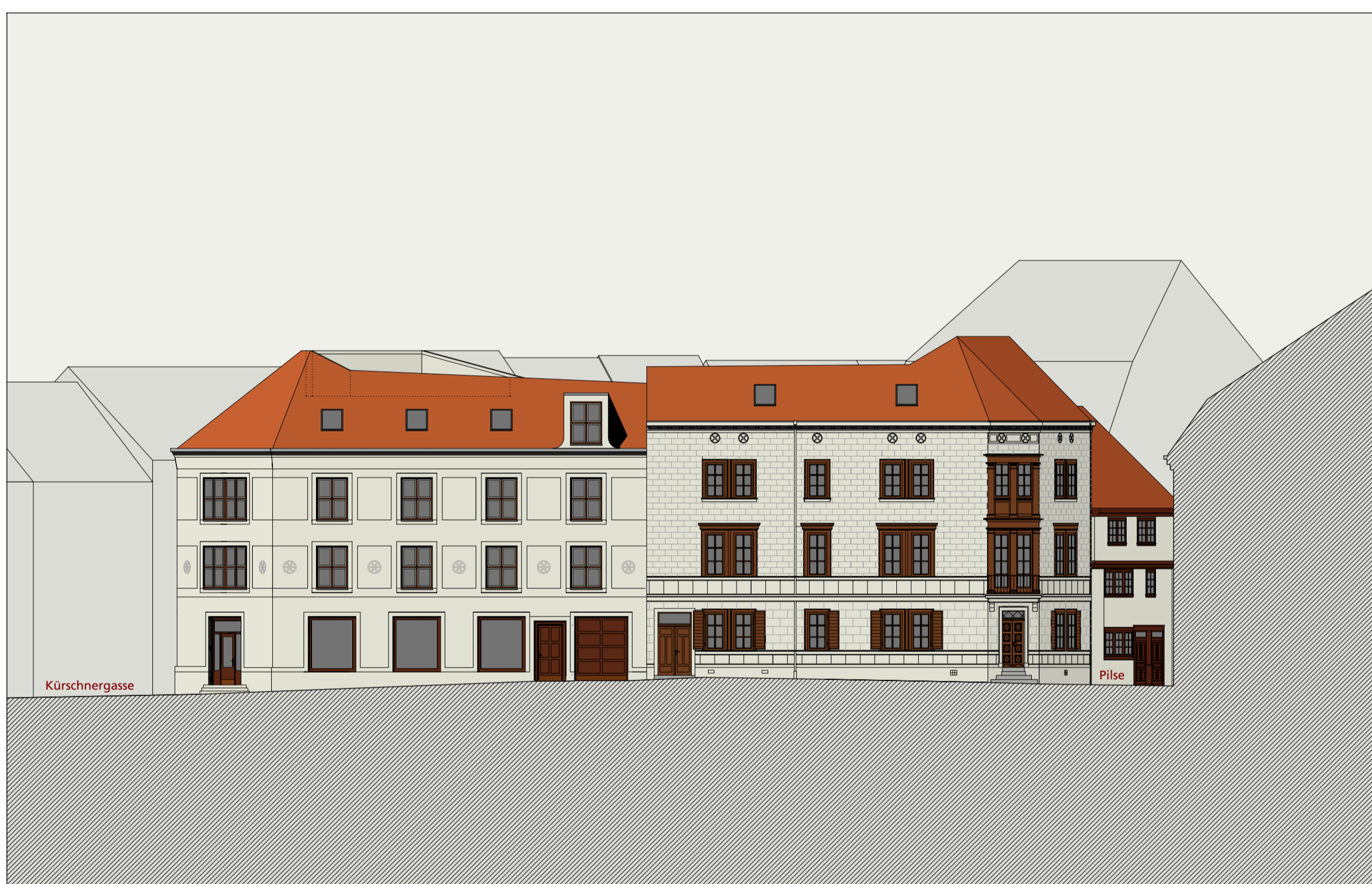
Ansicht Rupprechtsgasse 1:200