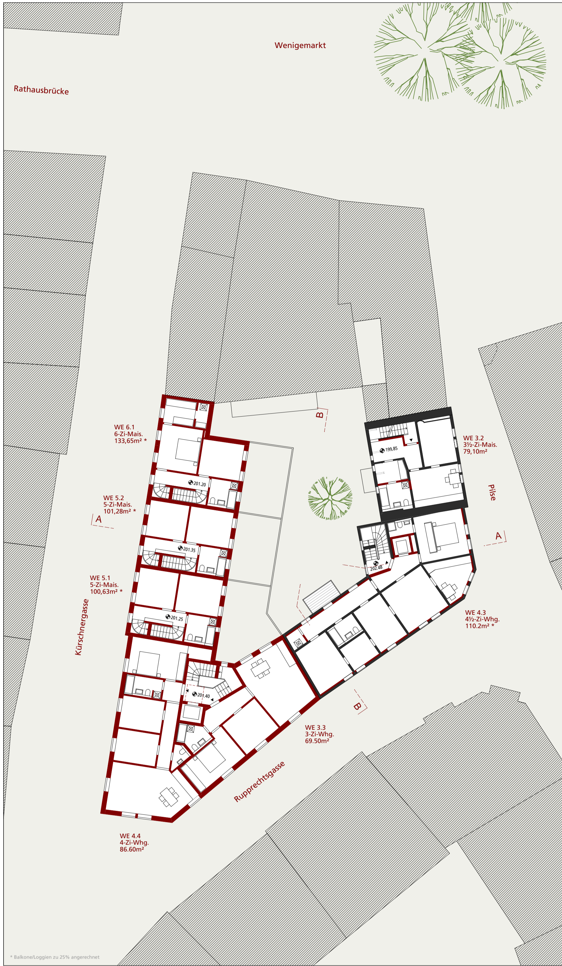
Grundriss 2.OG 1:200