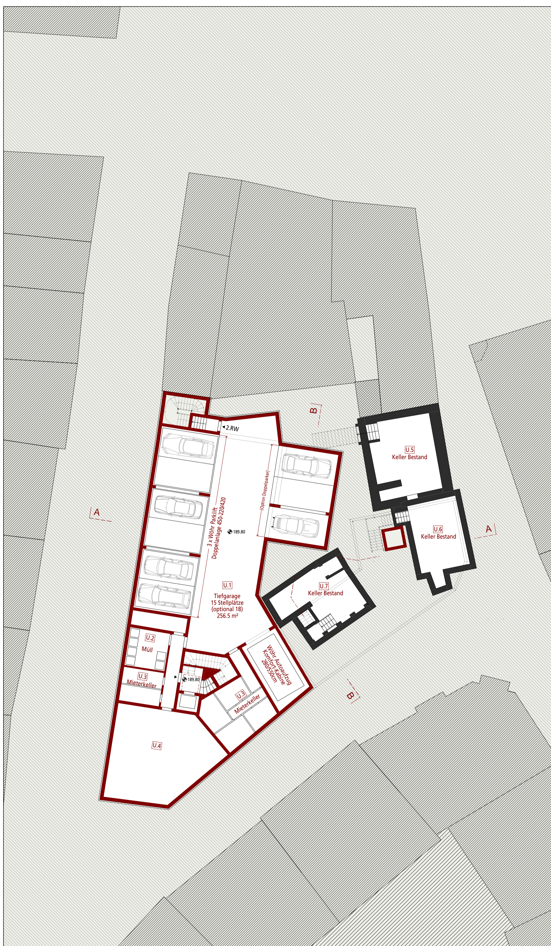
Grundriss UG 1:200