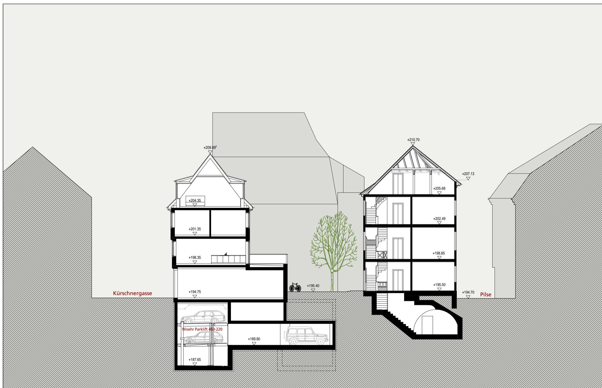
Schnitt A-A 1:200