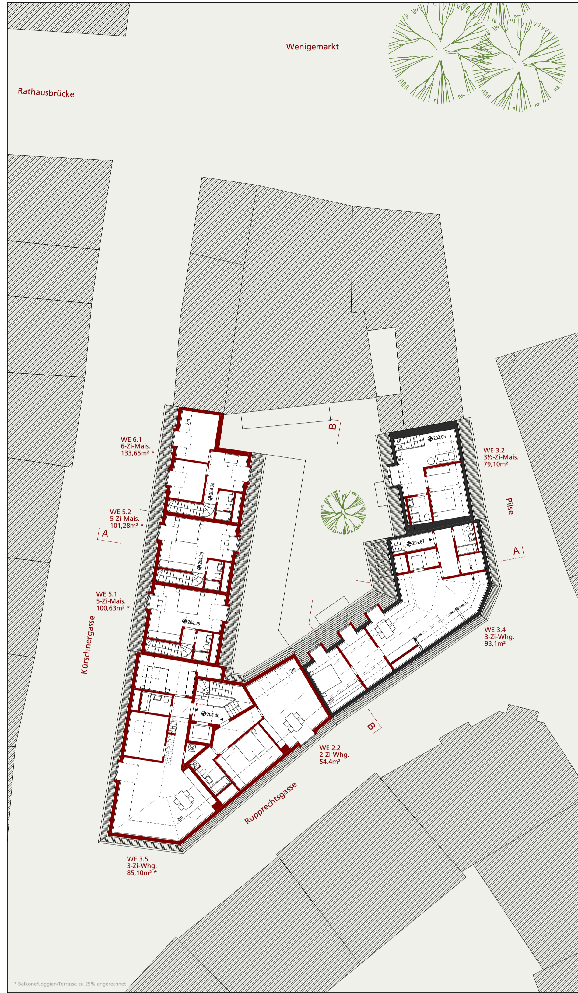
Grundriss DG 1:200