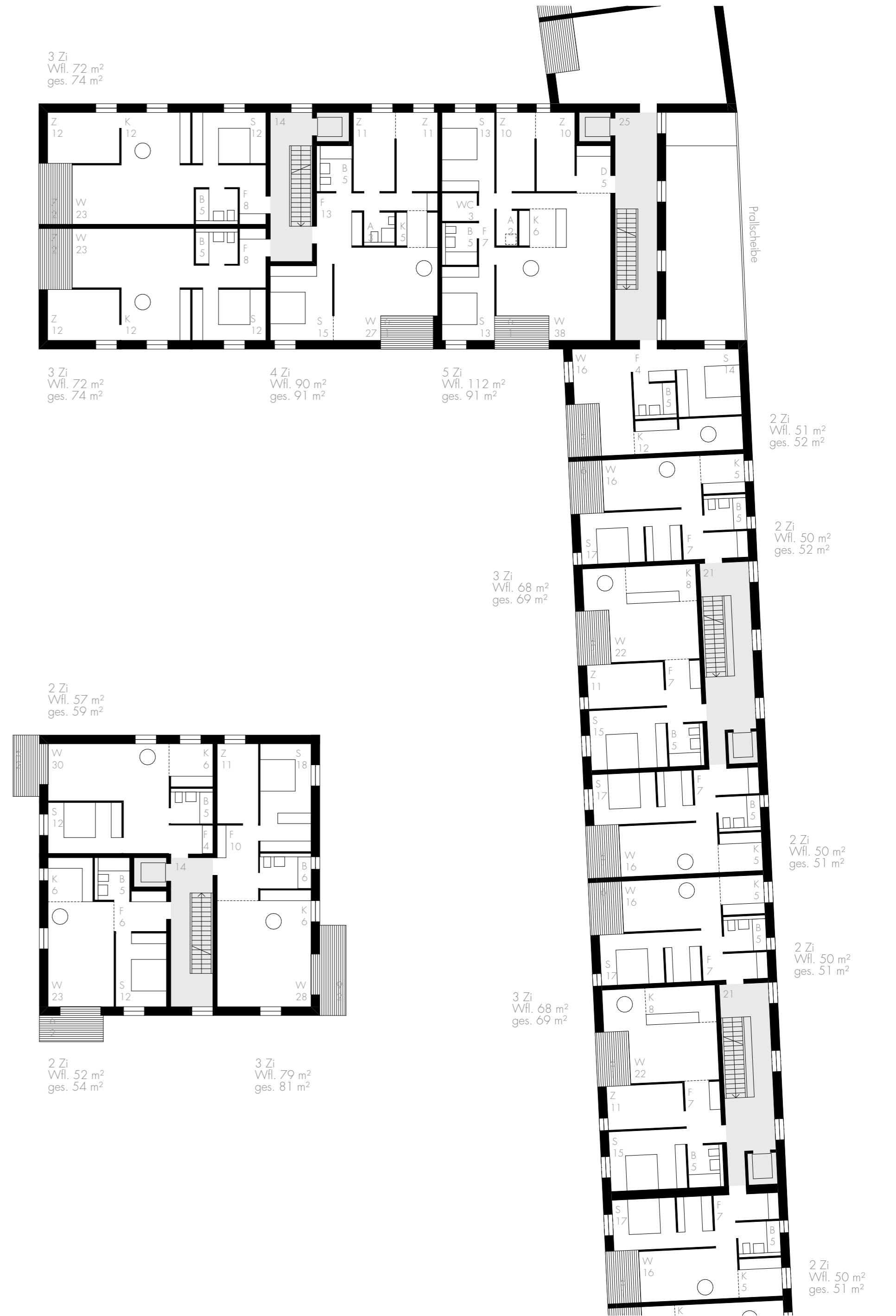
Regelgeschoss M 1:200