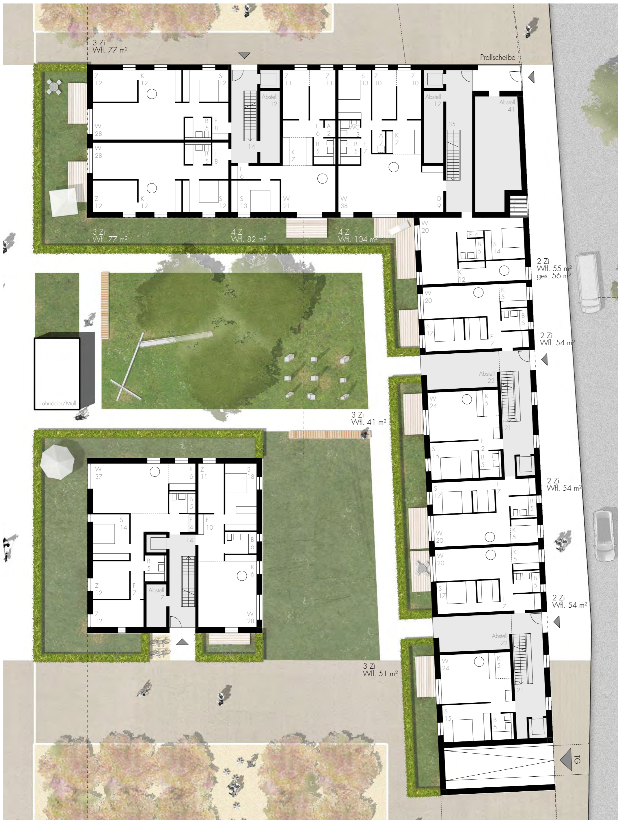
Erdgeschoss M 1:200