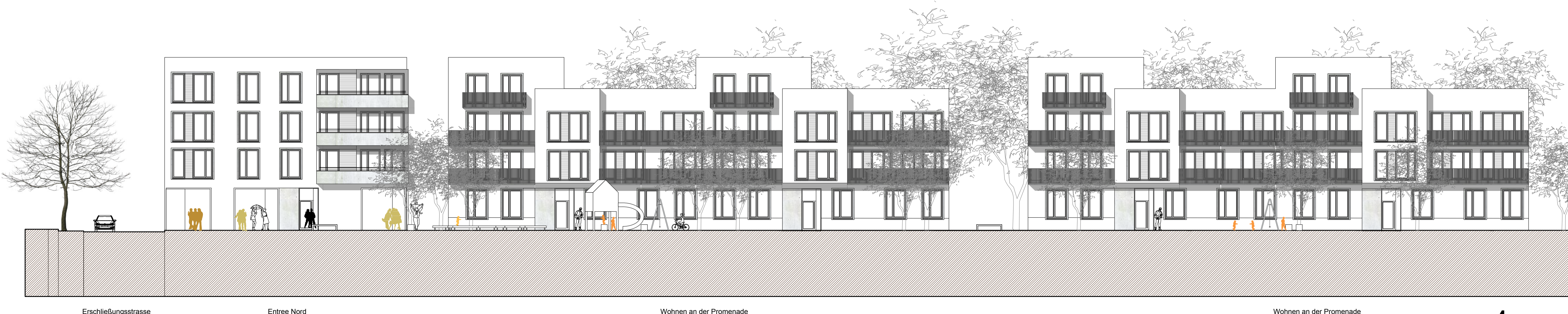
Schnittansicht Nord Süd M 1:200