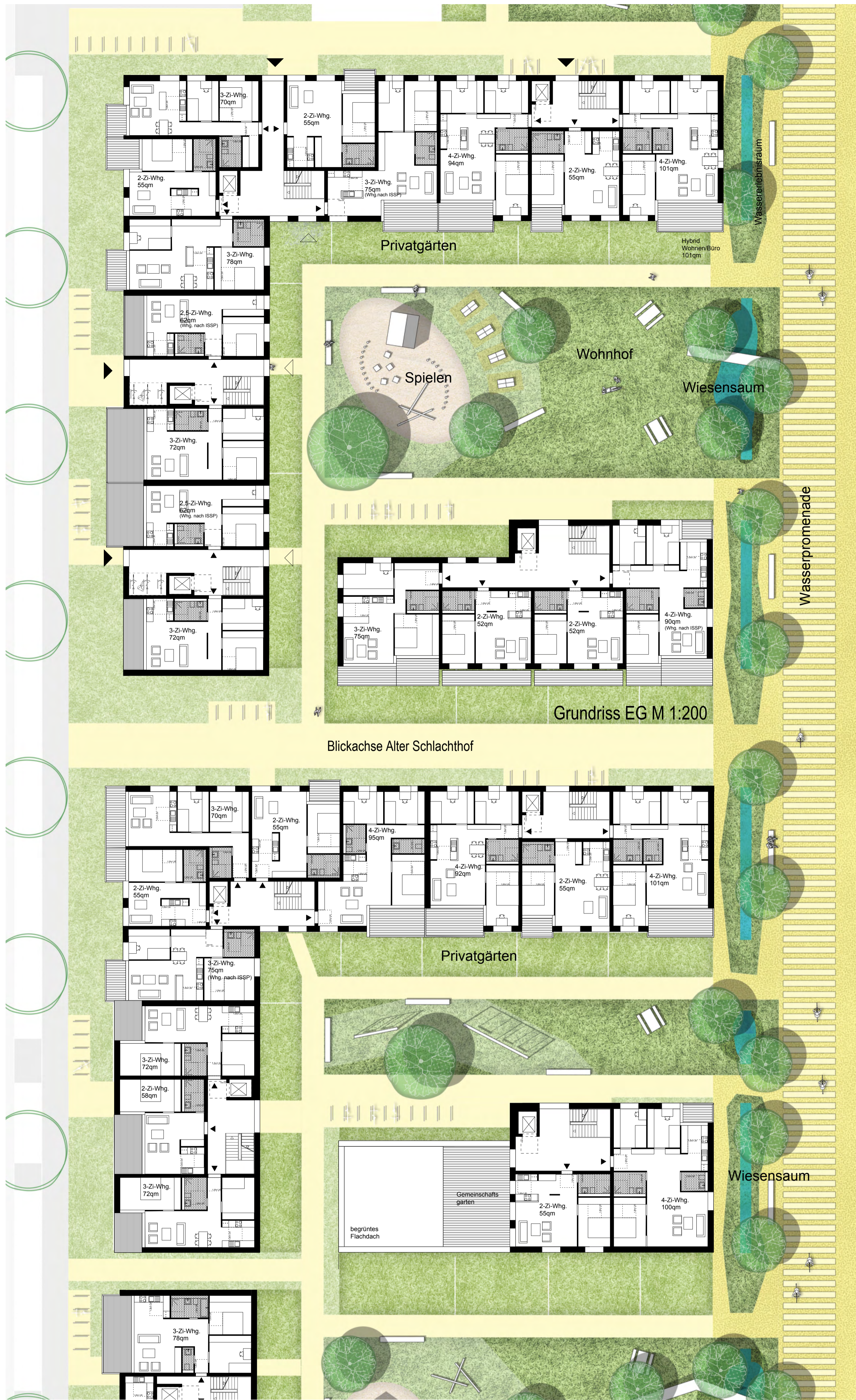
Grundriss RG + DG M 1:200