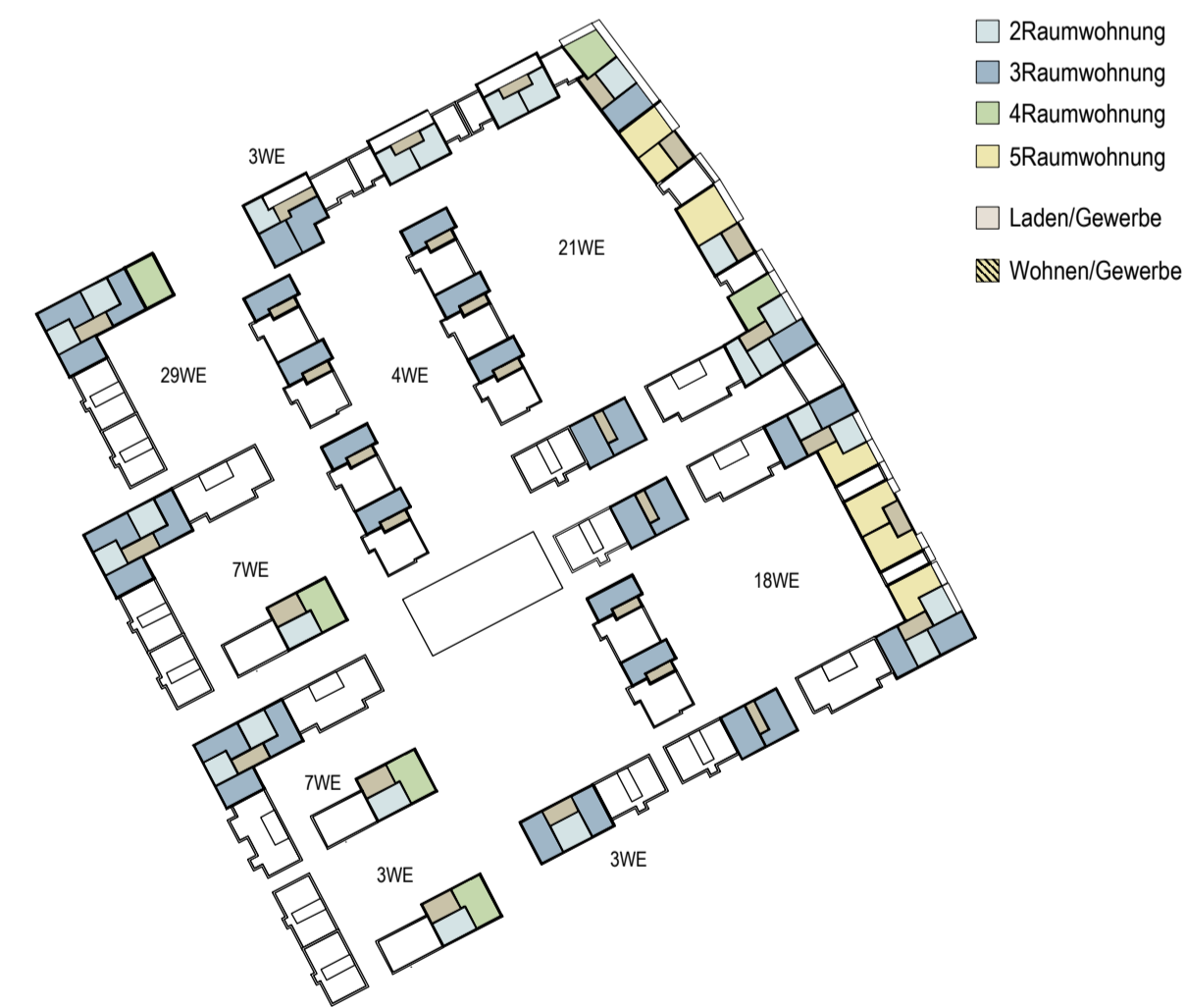
DG M 1:200 Nutzungsverteilung