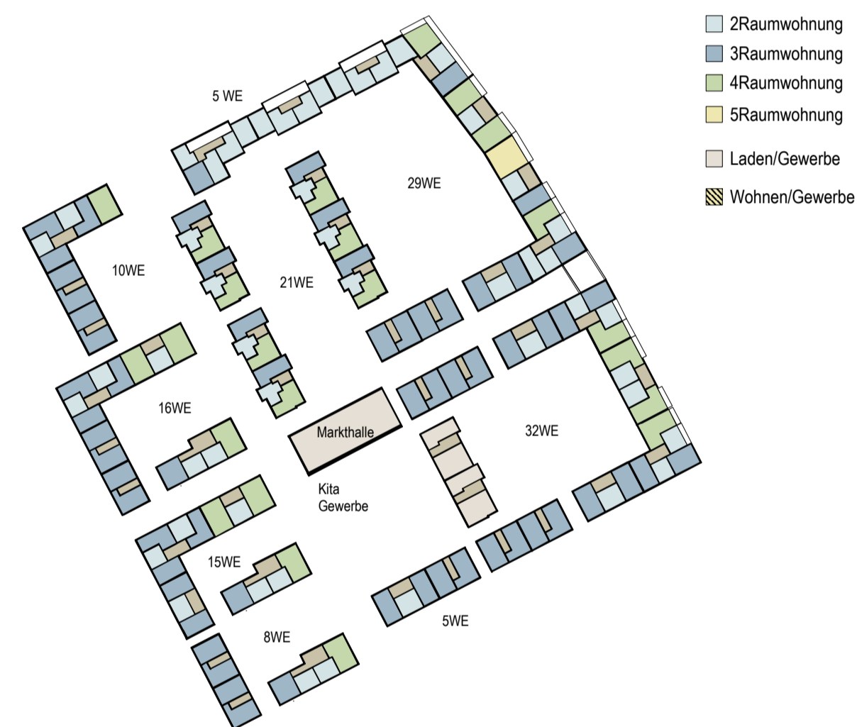
RG M 1:200