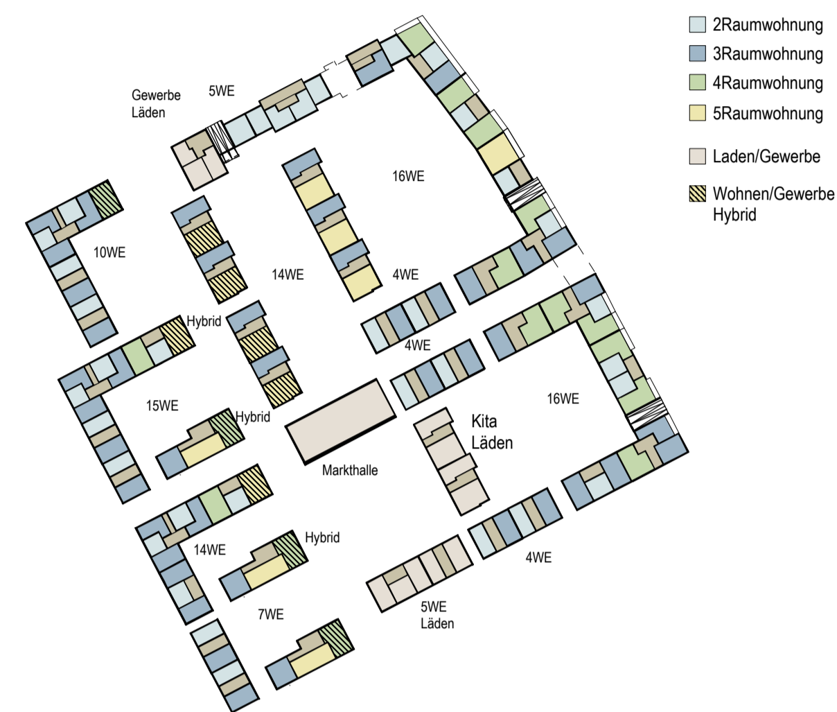
EG M 1:200