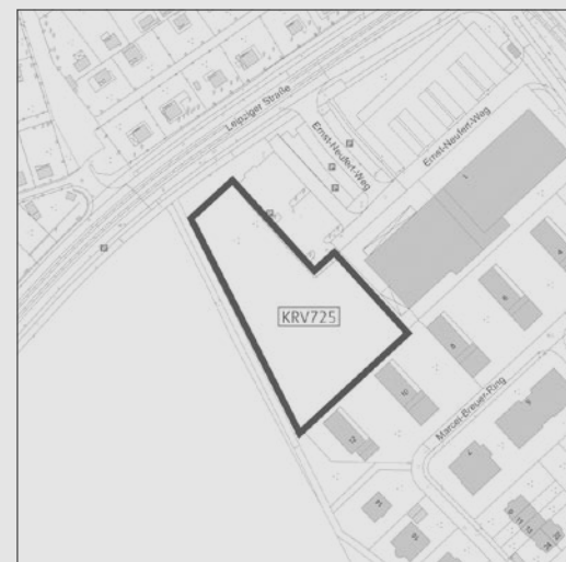
Zur Drucksache Nr. 1789/21