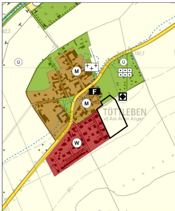
Abb. 1 – Auszug Neubekanntmachung des Flächennutzungsplanes der Stadt Erfurt vom 14.07.2017, Maßstab 1 : 10.000, Stand 24.03.2017, mit dem Bereich der FNP-Berichtigung Nr. 14.

Demzufolge wird die Fläche im Flächennutzungsplan künftig als Wohnbaufläche dargestellt. Die geordnete städtebauliche Entwicklung des Gemeindegebietes wird gewahrt.