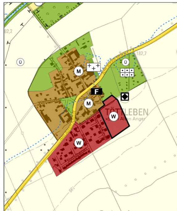
Abb. 2 – FNP-Berichtigung Nr. 14, Bereich Kerspleben, Bebauungsplan KER709 „Am Holzbiel“ in Töttleben, Stand 22.09.2020