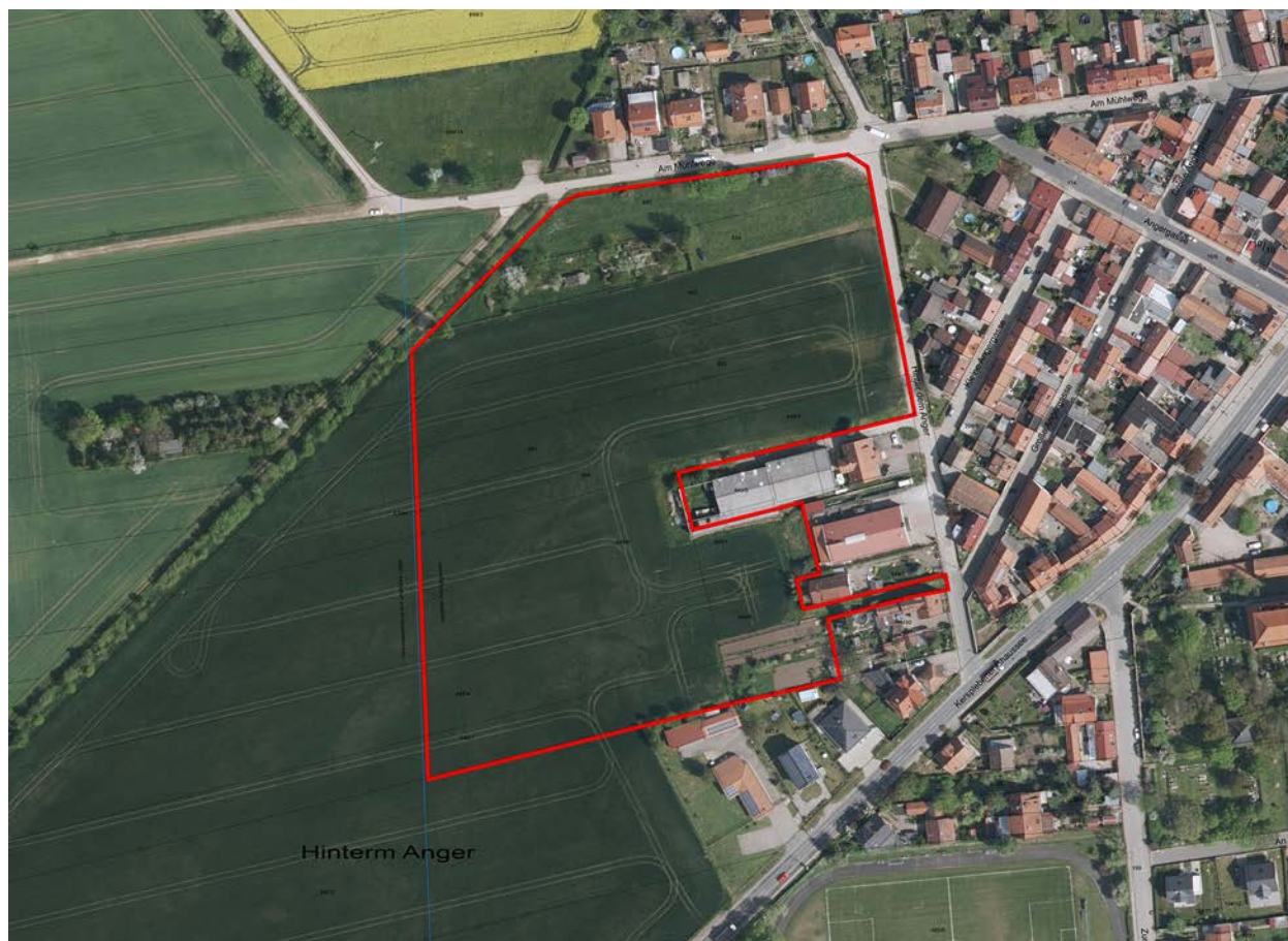
Lage des Plangebietes am südwestlichen Ortsrand von Kerspleben (Digitales Orthophoto 2016)

Das Plangebiet befindet sich am südwestlichen Ortsrand von Kerspleben unmittelbar im Anschluss an die bebaute Ortslage. Die Flächen westlich der Straße „Hinter dem Anger“ und südlich der Straße „Am Mühlwege“ sind aktuell weitgehend unbebaut. Lediglich im südöstlichen Teil dieses Bereichs ist an der Straße „Hinter dem Anger“ bereits eine gemischt genutzte Bebauung vorhanden; diese Grundstücke sind jedoch nicht Bestandteil des Geltungsbereiches. Das Gelände weist lediglich eine geringe Neigung von maximal 2% in nördliche Richtung auf und kann damit als weitgehend ebenflächig bezeichnet werden.