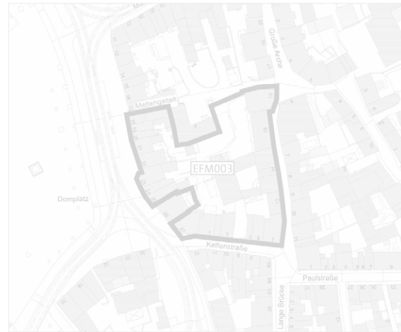
Zur Drucksache Nr. 0558/21

gez. Bausewein A. Bausewein Oberbürgermeister