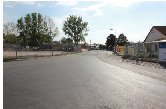
2020 Wustrower Weg, Blick nach Südwesten Richtung Straße am Kühlhaus Die Gleisanlage wurde zurückgebaut