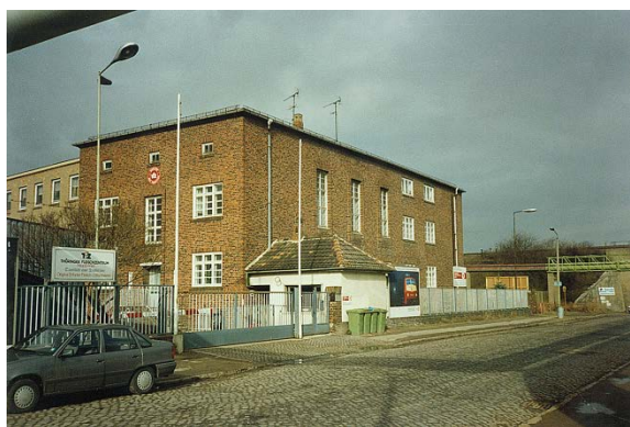
1992 Heckerstieg 3 Thüringer Fleischzentrum GmbH