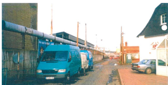
1998 Wustrower Weg, links: Kühnhaus, rechts: 3-Tage-Markt zu sehen: oberirdische Versorgungsleitung