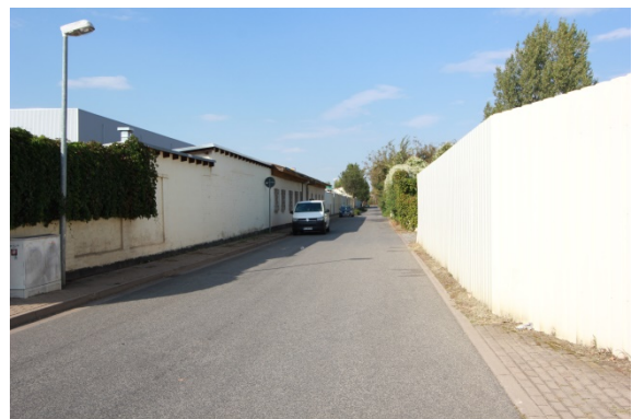
2020 Ladestraße II (westliche Ladestraße)