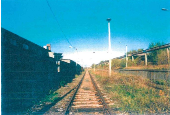
1998 Gleisanlagen der Industriebahn, links: Gebäude Heckerstieg 3