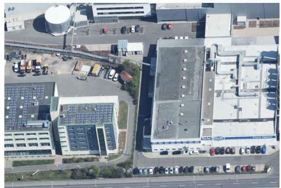
2020 Ausschnitt Schrägluftbild, im Vordergrund: Eugen-Richter-Straße, rechts und im Hintergrund: Erfurter Teigwaren GmbH, links im Vordergrund das sanierte Gebäude der SWE