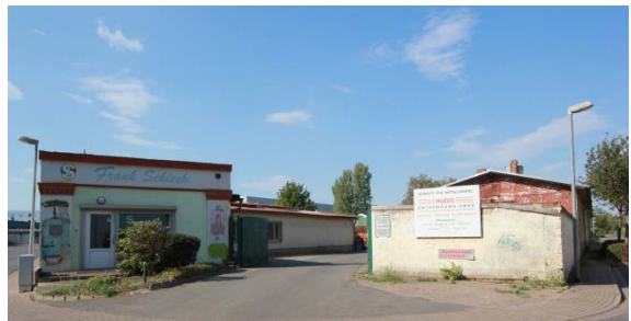
2020 Ladestraße I (östliche Ladestraße), Einfahrt Hugo-Entsorgung und Malerbetrieb Schieck