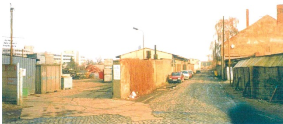
1998 Ladestraße II (westliche Ladestraße), Blickrichtung Norden