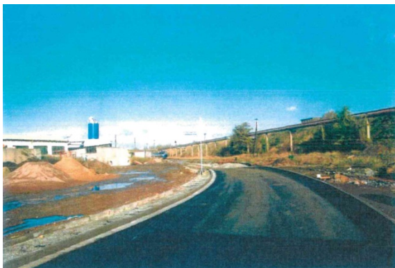
1998 Blick von der neuangelegten Ladestraße in Richtung Nordwesten, rechts: Gleisanlagen mit Sukzessionsflächen und einzelnen Gehölzen