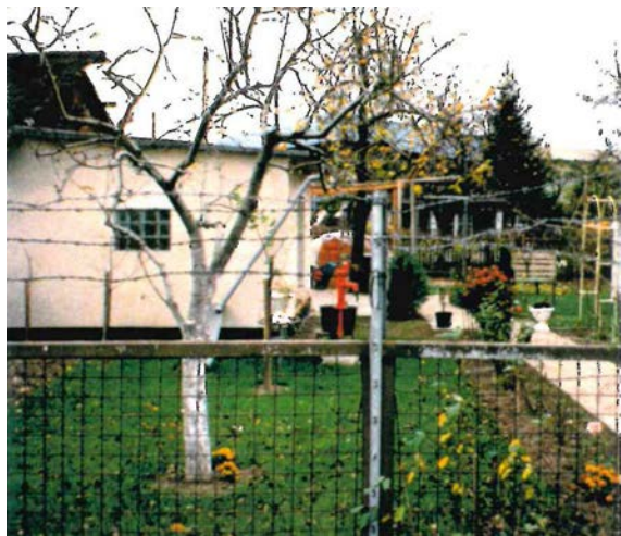
1997 Kleingartenanlage 'Vergissmeinnicht'