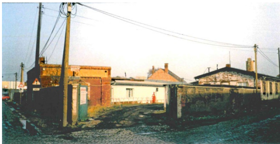
1997 Ladestraße I (östliche Ladestraße), Einfahrt Hugo-Entsorgung und Malerbetrieb Schieck