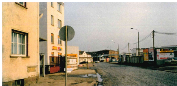
1997 Heckerstieg Am Heckerstieg befinden sich die Gebäude der Thüringer Fleischzentrum GmbH, Gebäude mit Büronutzung, der 3-Tage-Markt und Gebäude der Thüringer Kühlhäuser GmbH.