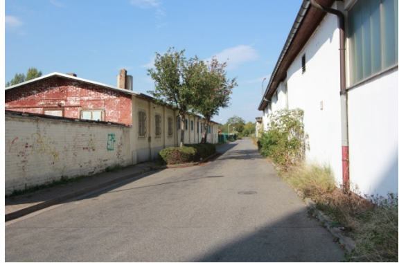
2020 Ladestraße I (östliche Ladestraße)