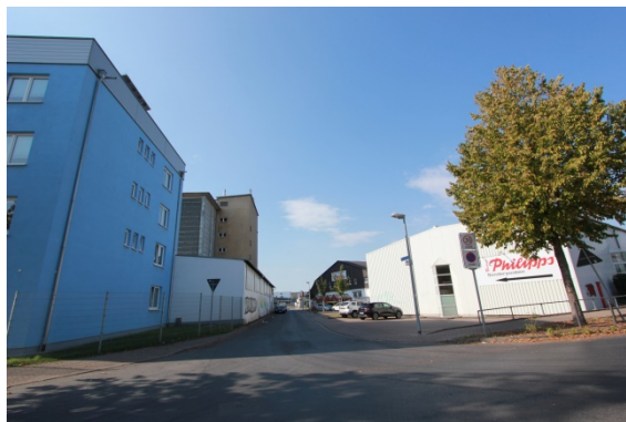
2020 Wustrower Weg