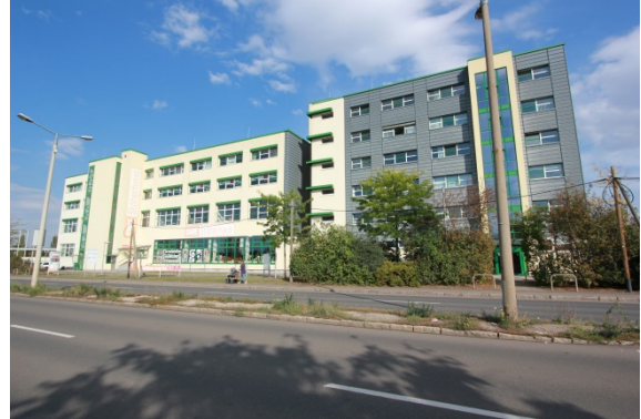
2020 Eugen-Richter-Stra e 26, In das gek urzte und sanierte Geb ude zog 2000 die Erfurter Stadtwirtschaft.