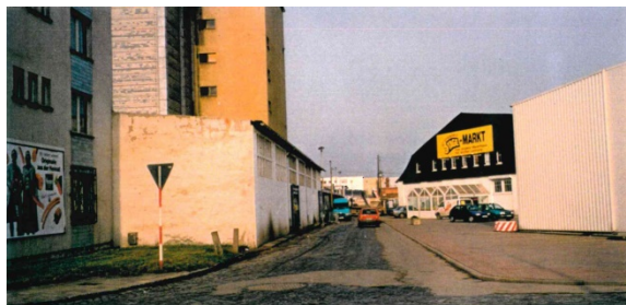
1997 Wustrower Weg, links: Kühnhaus, rechts: 3-Tage-Markt