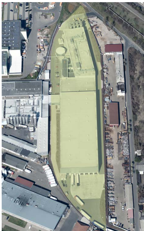
2020 Ausschnitt Schrägluftbild Erweiterung der Erfurter Teigwaren GmbH auf dem Gebiet der ehemaligen Kleingartenanlage