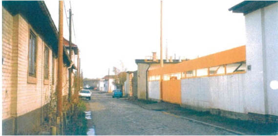
1998 Ladestraße I (östliche Ladestraße) rechts: Spedition Hasert