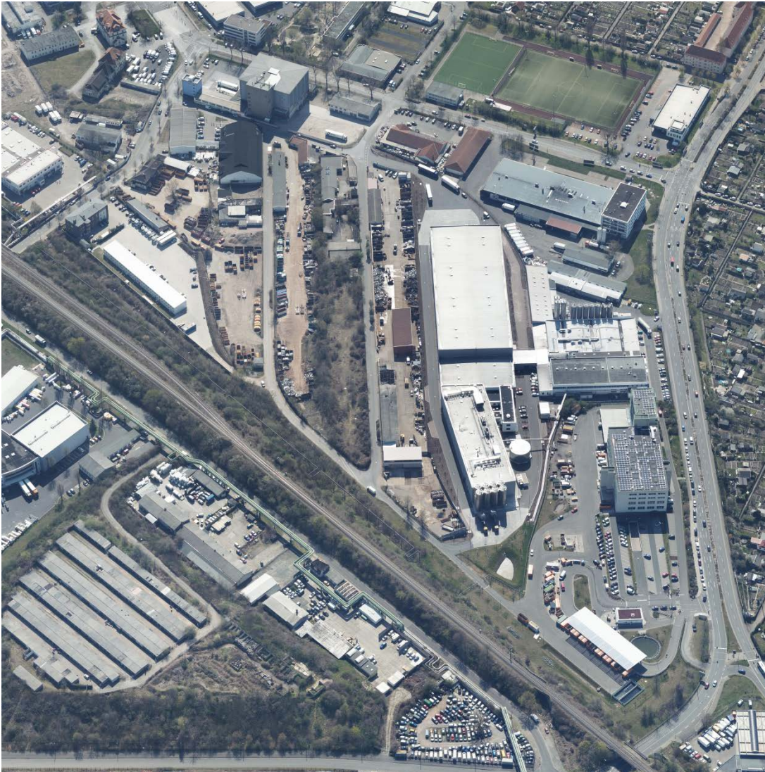
2020 – Schrägluftbild zum Zeitpunkt der Entlassung aus der Sanierung