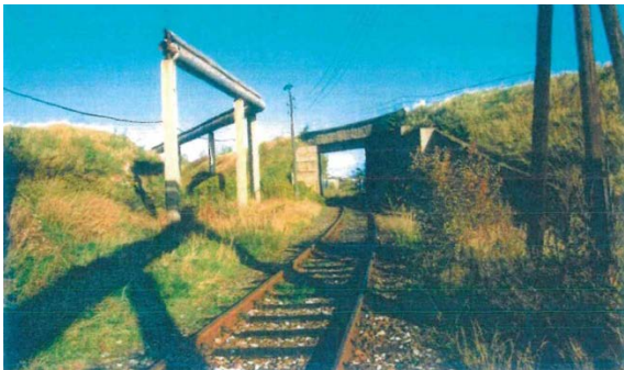
1998 Gleise der Industriebahn Blick in nördliche Richtung mit Unterführung unter den Gleisanlagen der Deutschen Bahn AG, seitlich: Sukzessionsflächen und alte Heiztrasse