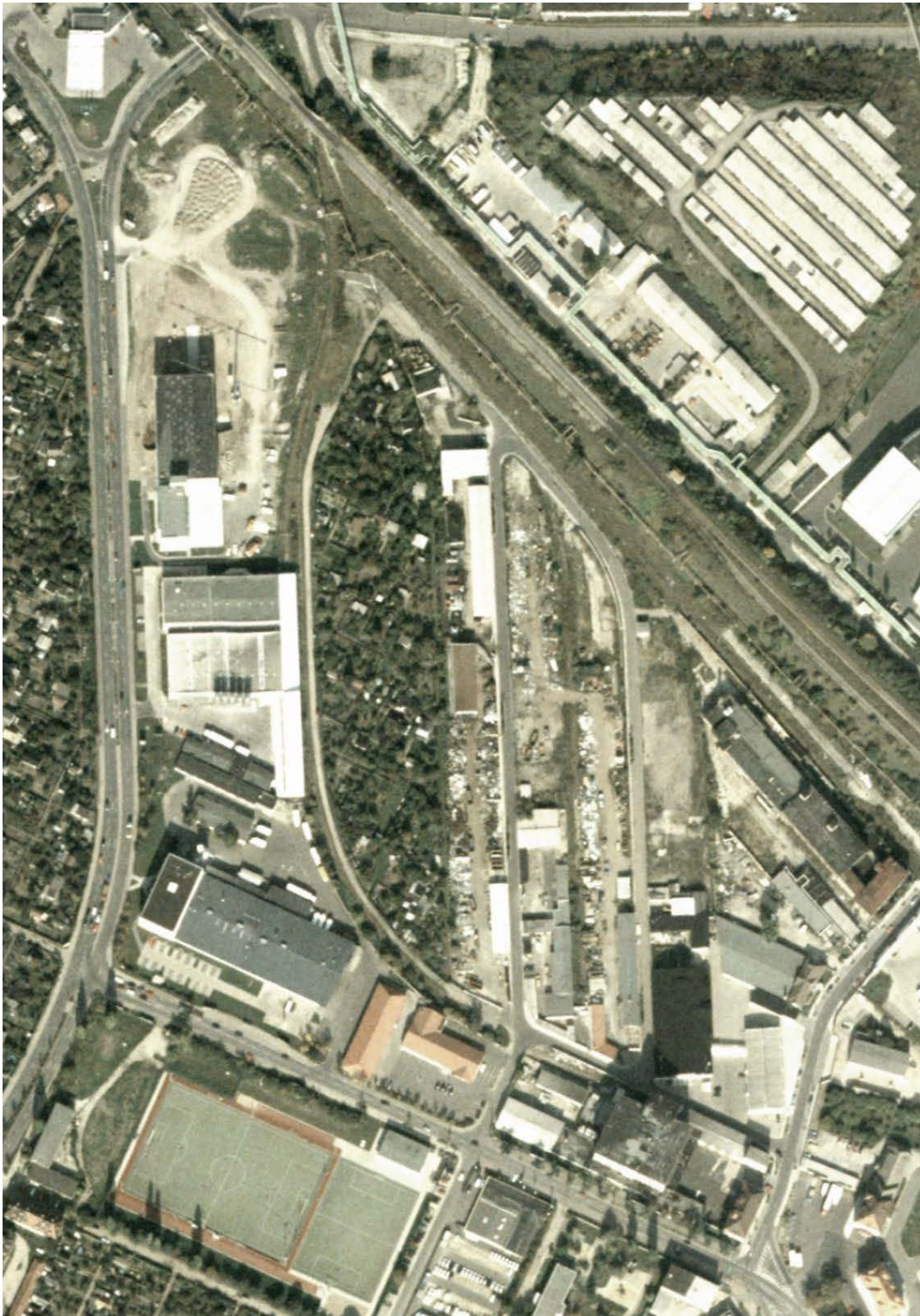
2001 – Luftbildaufnahme