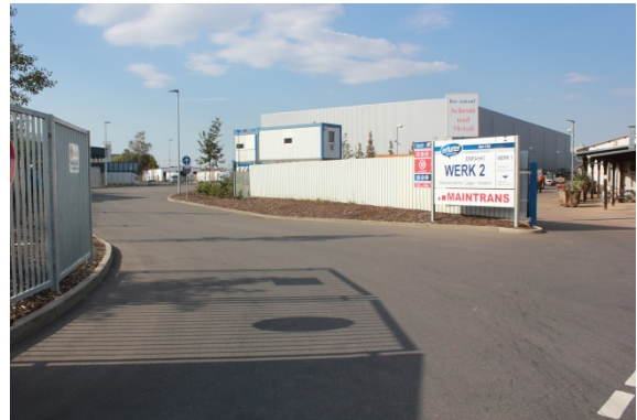
2020 Ladestraße II (westliche Ladestraße), neue Einfahrt zur Erfurter Teigwaren GmbH