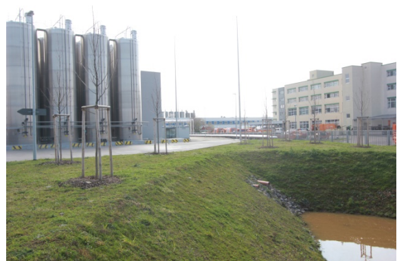
2020 Eugen-Richter-Stra e, links: Erweiterung der Erfurter Teigwaren GmbH