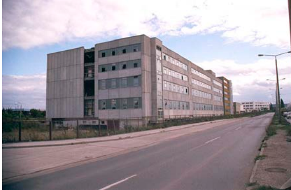
1994 Eugen-Richter-Straße 26 zu Beginn der Sanierung, Blick auf den verwaorlosten Rohbau, einst für die Konsum N ahrungsmittelwerke geplant und nicht fertiggestellt