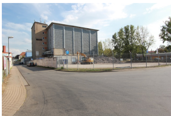
2020 Wustrower Weg, rechts: Erfurter Kühnhaus aktuell: Abriss eines ungenutzten Nebengebäudes