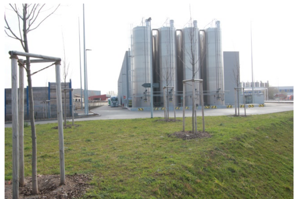
2020 Erfurter Teigwaren GmbH Blick in südliche Richtung, rechts der Produktionshalle/ Silos verliefen Kiesweg und Gleisanlage