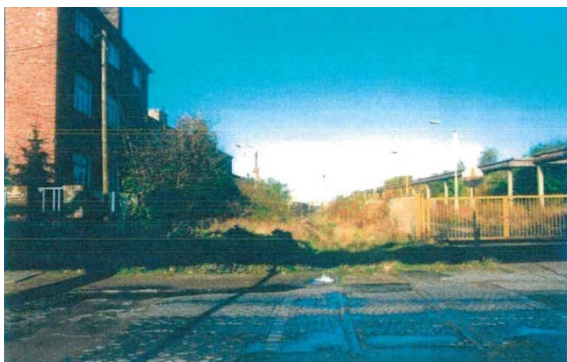
1998 Gleisanlagen der Industriebahn, Blick vom Heckerstieg nach Nordwesten