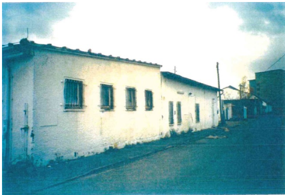
1998 Ladestraße I (östliche Ladestraße), ehemaliger Fischhandel, Blick nach Süden