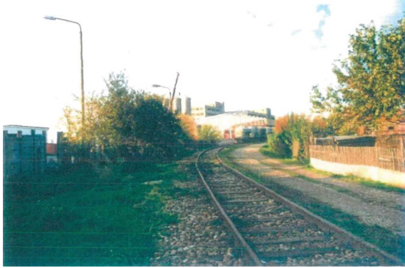
1998 Gleisanlage der Industriebahn in nördliche Richtung, im Hintergrund Gebäude der Erfurter Teigwaren GmbH, rechts: Kleingärten