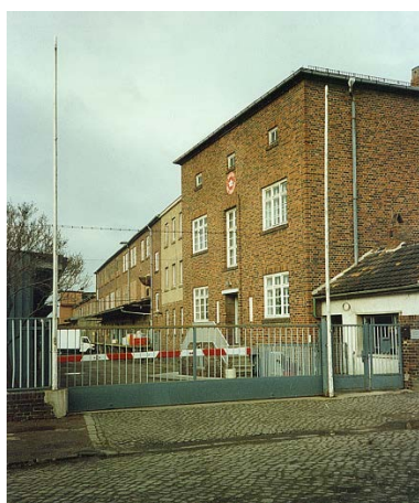
1992 Heckerstieg 3 Ehemaliges Fleischhandelskontor Blick in das langgestreckte Grundstück in Richtung Nordwesten