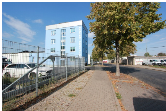
2020 Heckerstieg Die Straße wurde neu gestaltet und mit einer Gehölzreihe bepflanzt. Das Gebäude im Vordergrund wurde geräumt.