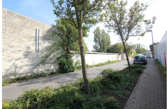
2020 Ladestraße II (westliche Ladestraße), Blick in südliche Richtung