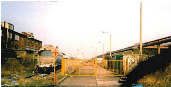
1997 Rechts im Bild: Bahngleistrasse nordöstlich des Gewerbegebietes Ladestraße Richtung Nordhausen