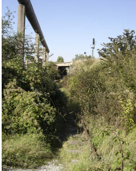
2007 Blick in nördliche Richtung auf die stillgelegte, eingegrünte Unterführung