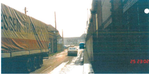
1998 Wustrower Weg, Blick nach Südosten Richtung Gewerbegebiet Schlachthof