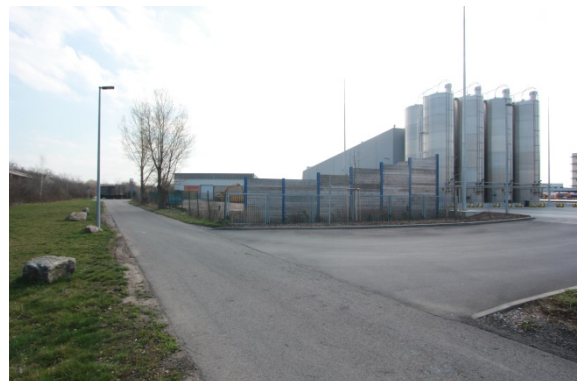
2020 rechts: Erweiterung der Erfurter Teigwaren GmbH auf den Flächen der ehemaligen Kleingartenanlage Blick in südliche Richtung