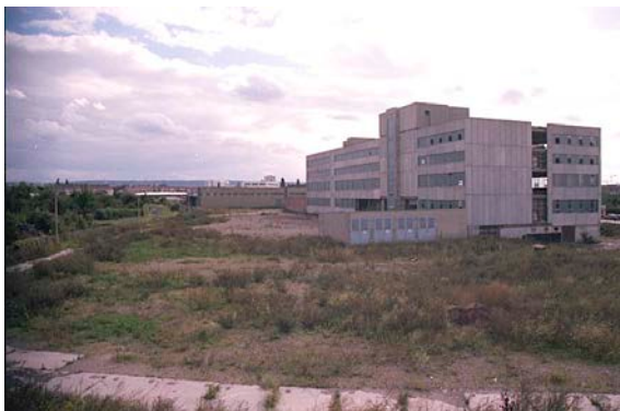
1994 Eugen-Richter-Stra e, brachgefallenes Grundst ck