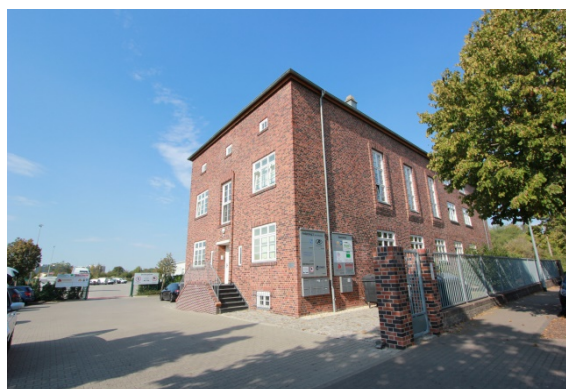
2020 Heckerstieg 3