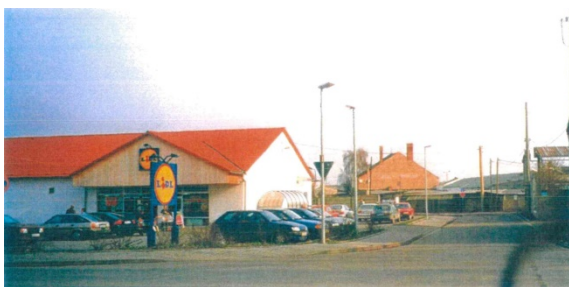
1998 Wustrower Weg, Lidl-Markt