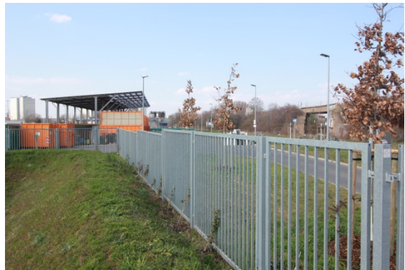
2020 rechts: stillgelegte Unterführung links: Flächen der SWE Stadtwirtschaft GmbH