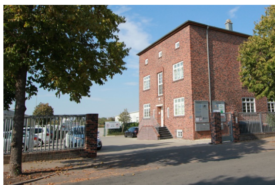
2020 Heckerstieg 3