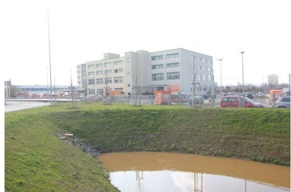
2020 Eugen-Richter-Stra e 26, Wirtschafts- und Stellplatzfl chen, im Vordergrund das Regenr ckhaltebecken