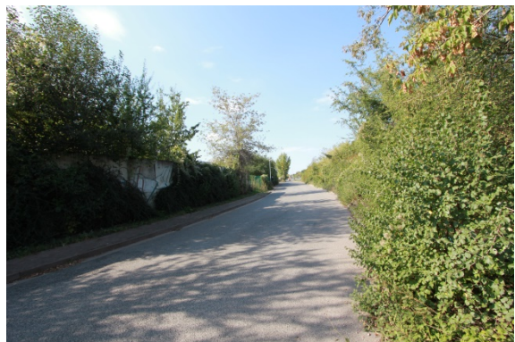
2020 Blick von der Ladestraße in Richtung Nordwesten, rechts: Die Vegetation verdeckt Freileitung und Gleisanlagen.