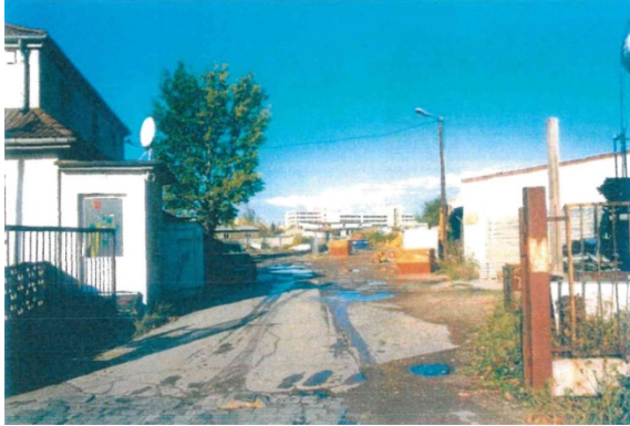
1998 Heckerstieg 2 Blick in das Gewerbe-/ Industriegebiet in nordwestliche Richtung