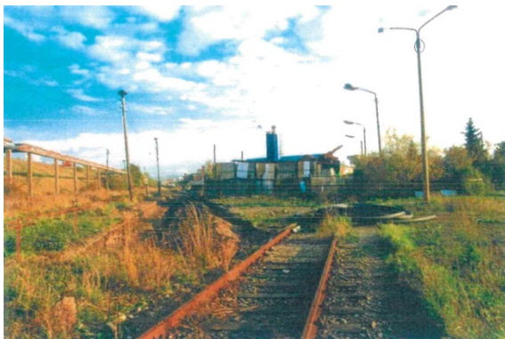
1998 Gleisanlagen der Industriebahn, Blick in südliche Richtung (Richtung Kleingärten)