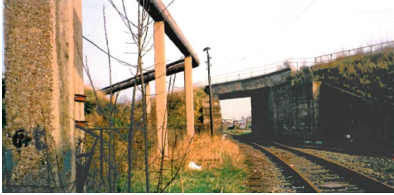
1997 Bahnunterführung nahe der Eugen-Richter-Straße 26