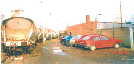
1998 Ladestraße II (westliche Ladestraße), Blick in nordwestliche Richtung