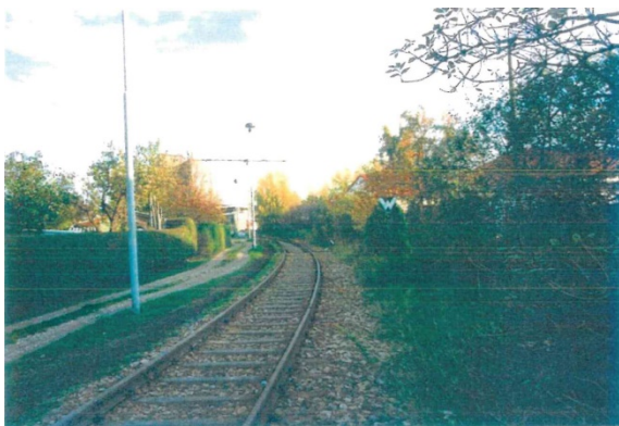
1998 Blick entlang der Gleisanlage in südliche Richtung, links: Kleingartenanlage, rechts: Grünstreifen mit vereinzelt Gehölzen und Heckengruppen, im Hintergrund die Gebäude der Erfurter Kühlhaus GmbH