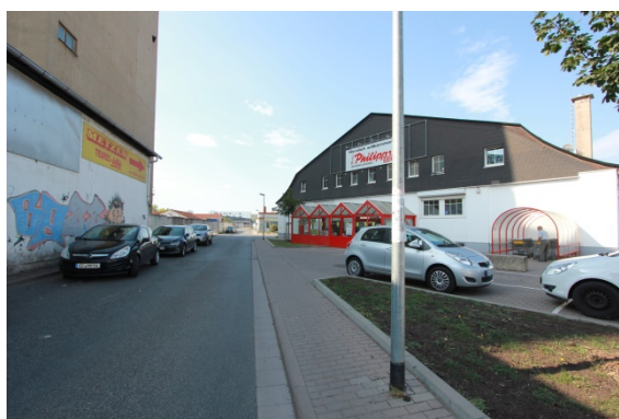
2020 Wustrower Weg