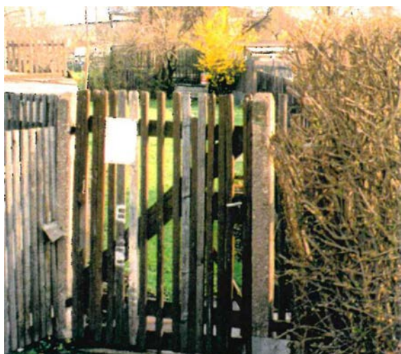
1997 Kleingartenanlage 'Vergissmeinnicht'