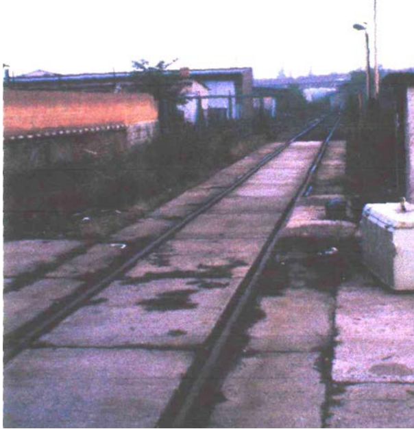
1997 Gleisanlage im Ladestraßenbereich