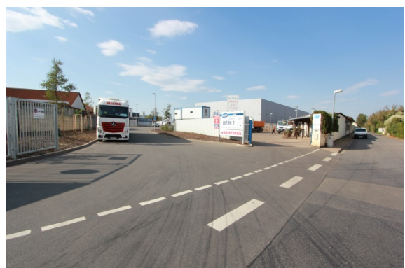
2020 Ladestraße II (westliche Ladestraße), neue Einfahrtssituation zur Erfurter Teigwaren GmbH und SMH-Schrott- und Metallhandels GmbH