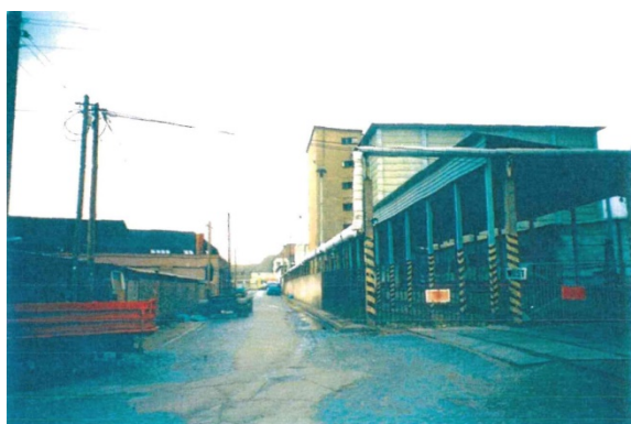
1998 Wustrower Weg, rechts: Erfurter Kühnhaus Versorgung über Freileitungen