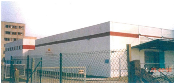
1997 Eugen-Richter-Straße 27