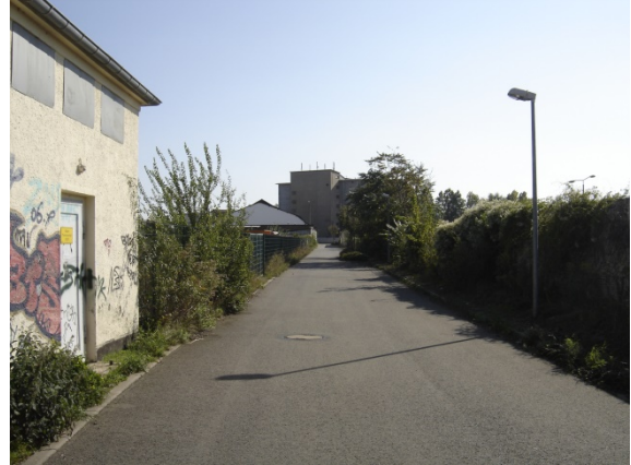
2007 Ladestraße I (östliche Ladestraße), Blick Richtung Süden