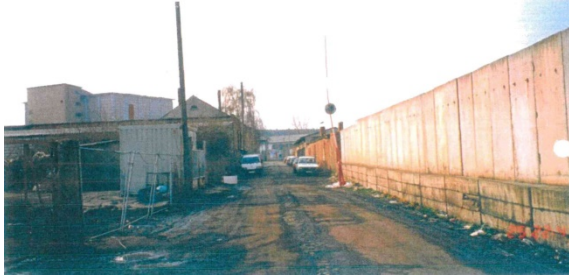
1998 Ladestraße II (westliche Ladestraße), Blick in südliche Richtung, rechts: Schrotthändler, links: ERFEGAU