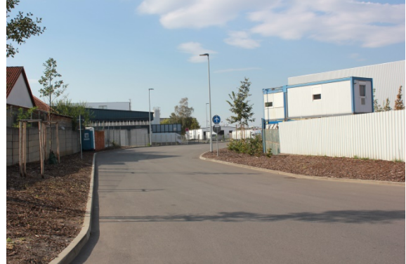
2020 Einfahrt Erfurter Teigwaren GmbH vom Wustrower Weg aus, Blick Richtung Norden Die Straße befindet sich im Bereich des ehemaligen Kiesweges und der Gleisanlage.