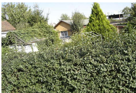
2007 Kleingartenanlage 'Vergissmeinnicht'