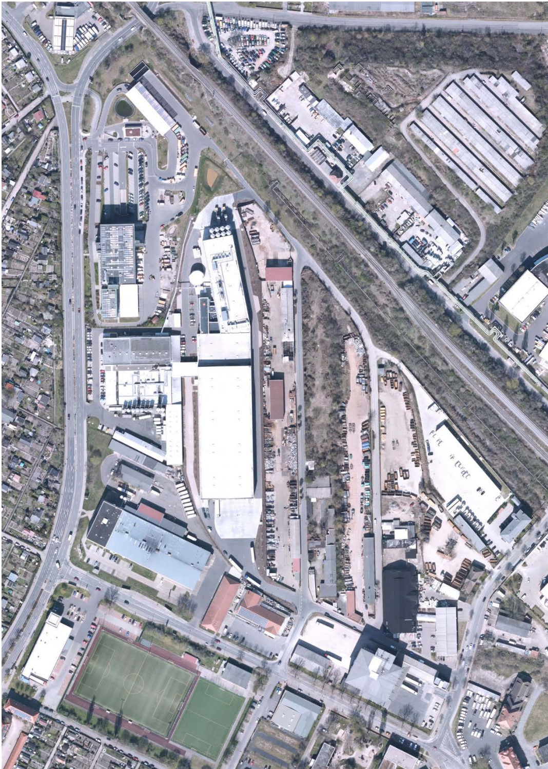
2020 – Luftbildaufnahme zum Zeitpunkt der Entlassung aus der Sanierung