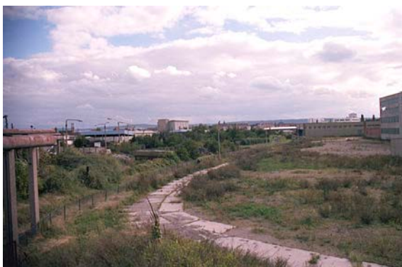
1994 Eugen-Richter-Stra e, Blick auf die Kleingartenanlage