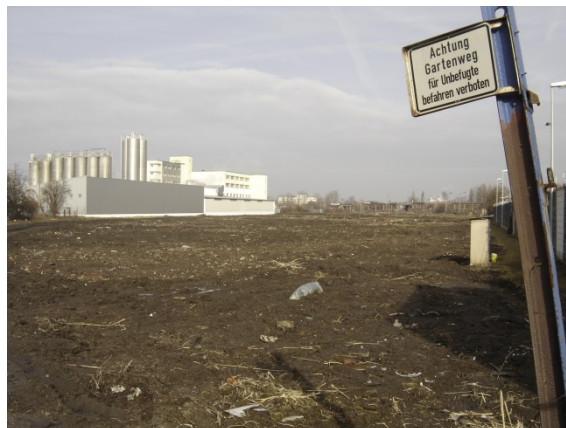
2009 Kleingartenanlage, Weg und Gleistrasse wurden zurückgebaut.