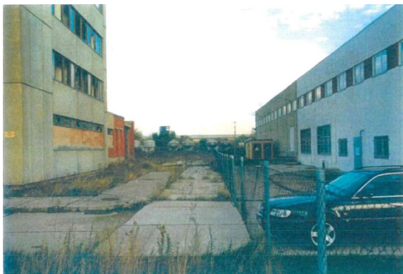
1998 Blick von der Eugen-Richter-Straße in Richtung Kleingartenanlage, rechts: Erfurter Teigwaren GmbH, links: Gebäuderuine