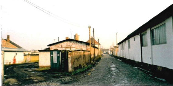
1997 Ladestraße I (östliche Ladestraße)