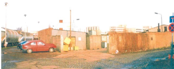
1998 Ladestraße II (westliche Ladestraße) Blick zur Einfahrt ehemals MRT