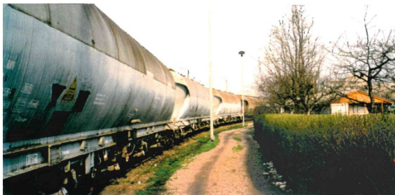
1997 Kiesweg westlich der Kleingartenanlage 'Vergissmeinnicht', links: Waggons der Erfurter Teigwaren GmbH, Blickrichtung Norden