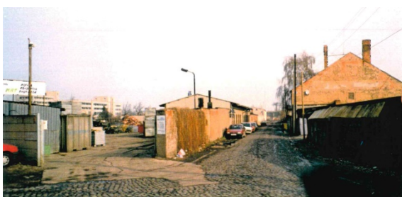
1997 Ladestraße II (westliche Ladestraße), Einfahrt Metallrohstoffe Thüringen GmbH