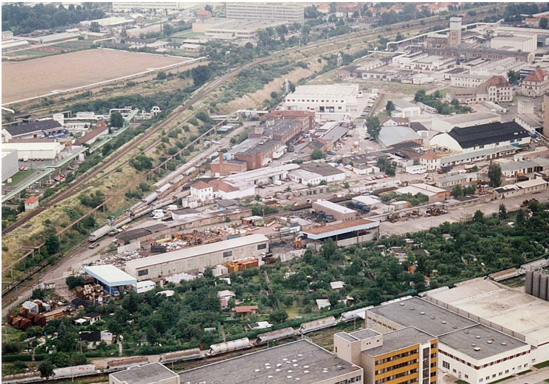
1997 – Luftbildaufnahme zu Beginn der Sanierung Blick über das Gewerbegebiet Ladestraße mit der Kleingartenanlage in Insellage