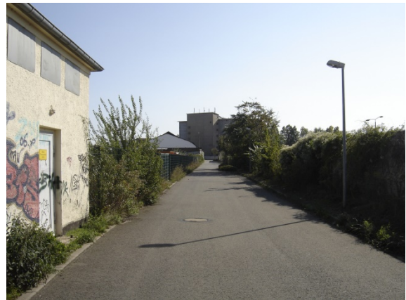
2007 Ladestraße I (östliche Ladestraße), Blick nach Süden