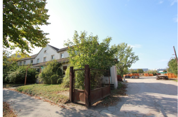
2020 Heckerstieg 2 Das Gebäude ist von der Stadt Erfurt an ein im Gebiet ansässiges Unternehmen vermietet.