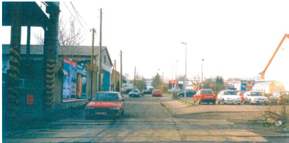
1998 Wustrower Weg, Blick nach Südwesten Richtung Straße am Kühlhaus