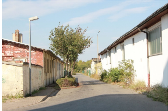
2020 Ladestraße I (östliche Ladestraße)