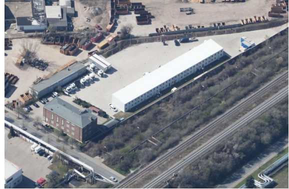
2020 Ausschnitt Schrägluftbild im Vordergrund: Heckerstieg und Gleistrasse der Deutschen Bahn mit ausgedehntem Grünstreifen