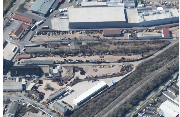
2020 Ausschnitt Schrägluftbild im Bereich der Ladestraße Die Gleisanlagen wurden überwiegend zurückgebaut bzw. werden nicht genutzt. Die Erschließung erfolgt ausschließlich über die Straße.