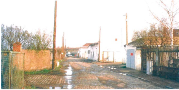
1998 Ladestraße I (östliche Ladestraße), rechts: ehemaliger Fischhandel, links: Hugo- Entsorgung, Blick Richtung Norden