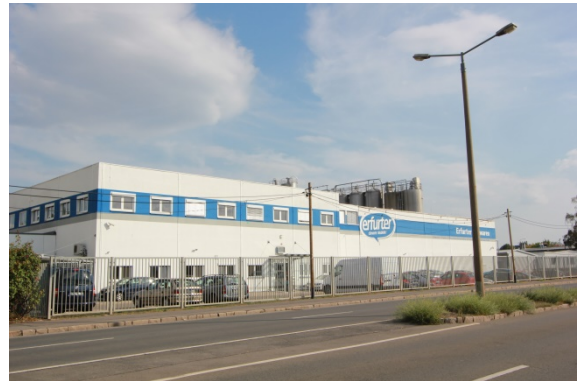
2020 Eugen-Richter-Straße 27