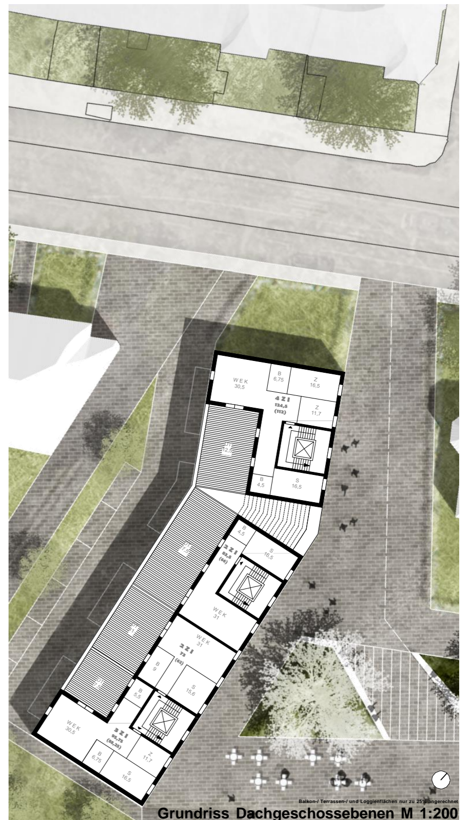
Grundriss Dachgeschossebenen M 1:200