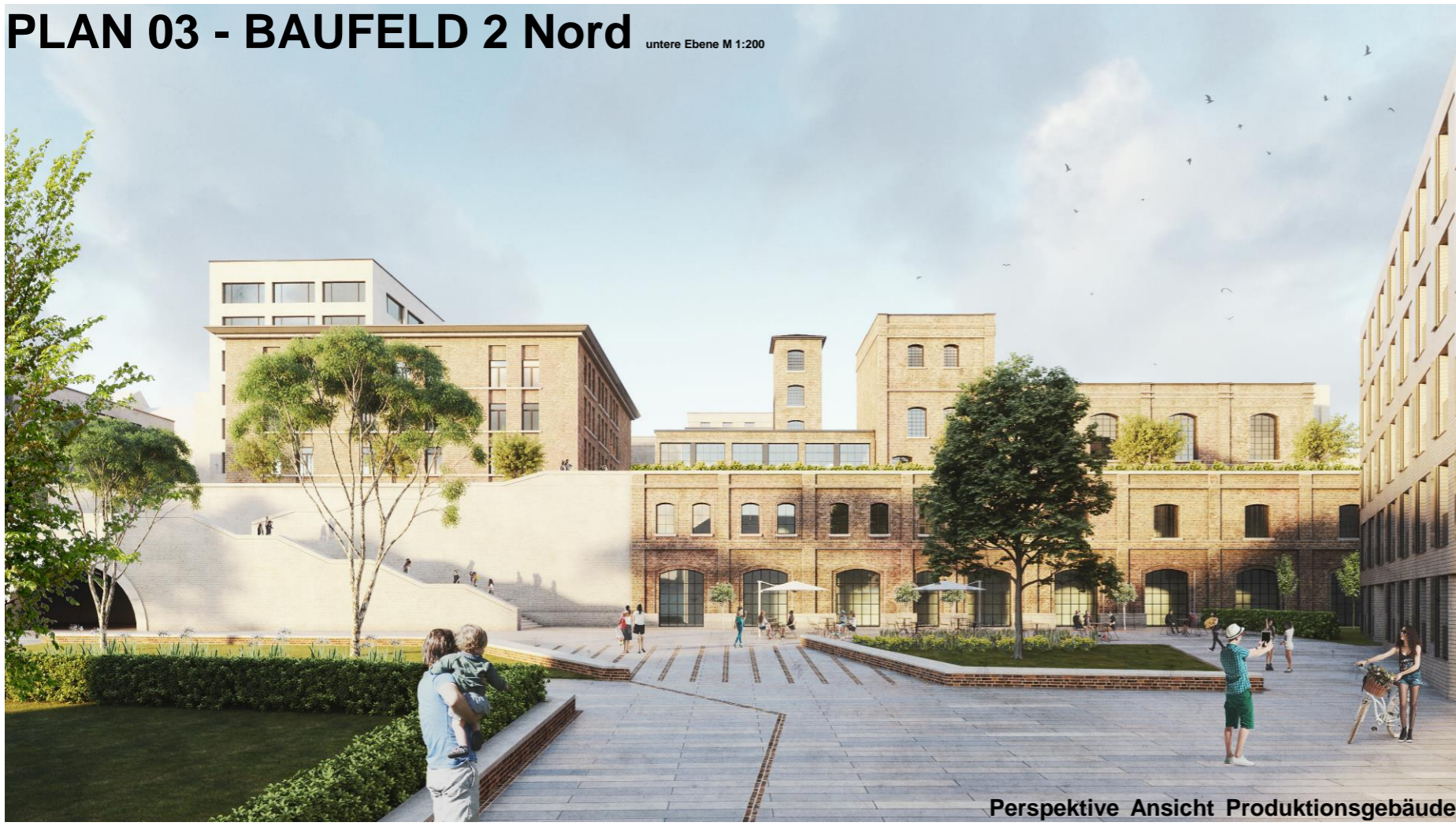
Perspektive Ansicht Produktionsgebäude