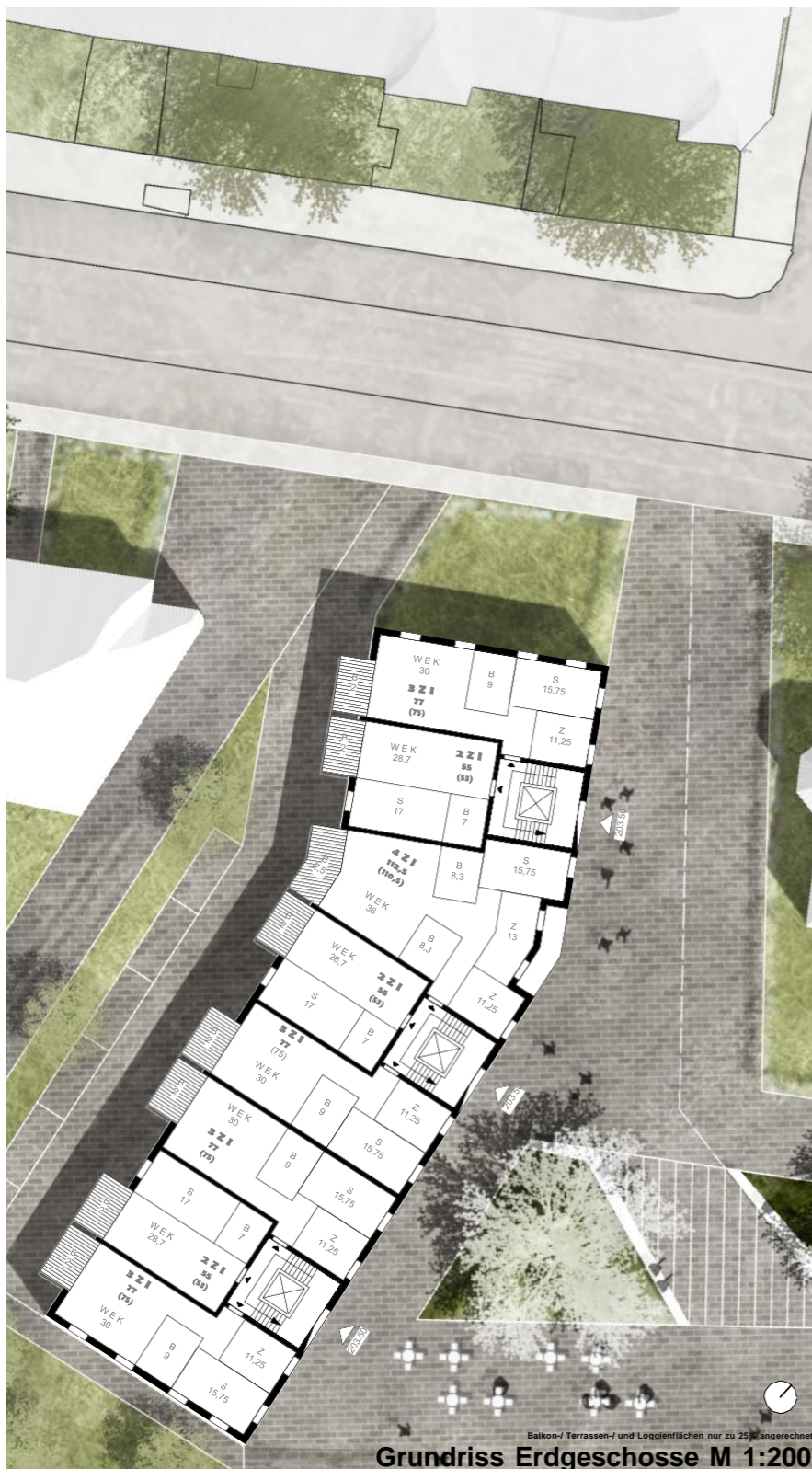
Grundriss Erdgeschoss M 1:200