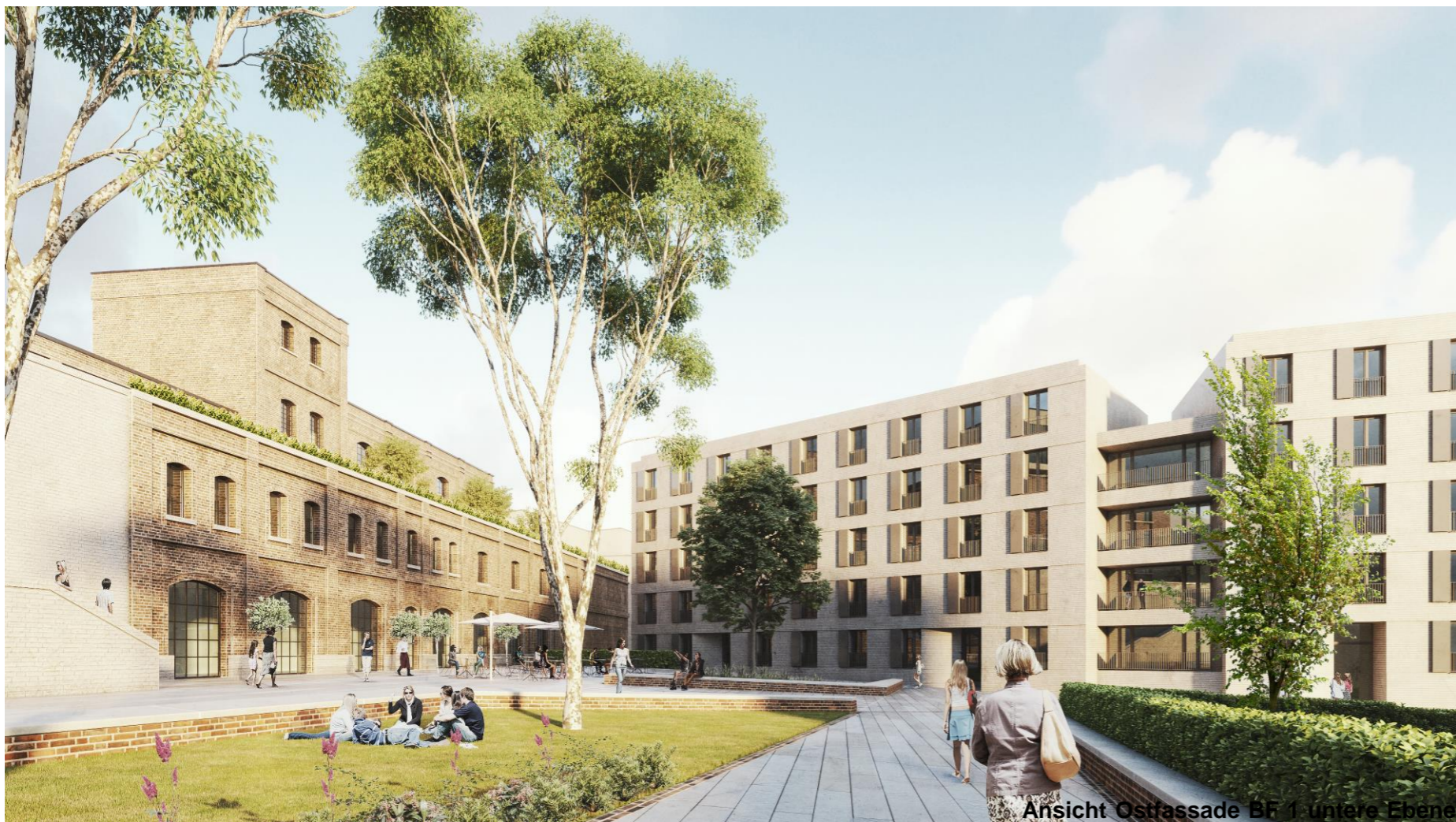
Ansicht Ostrassade BF 1 untere Ebene