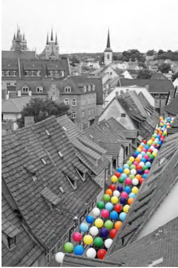
2016_Samantha Font-Sala Luftballons