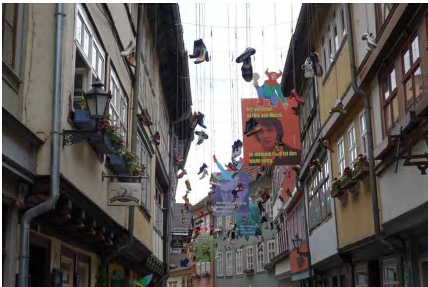
2018_VBK_Carl Ulrich Spannaus Til Eulenspiegel auf der Krämerbrücke