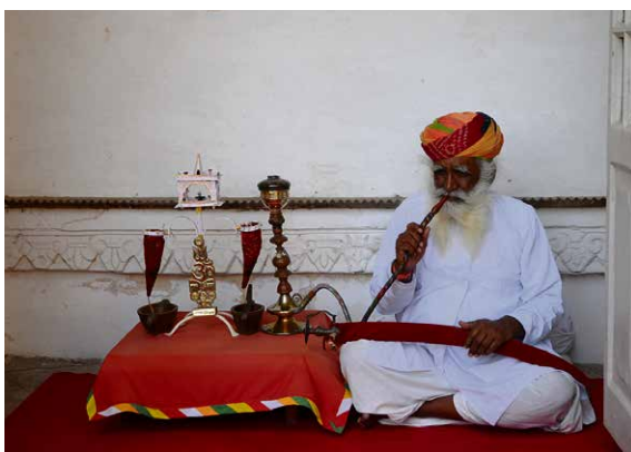
Hindu im Mehrangarh Fort