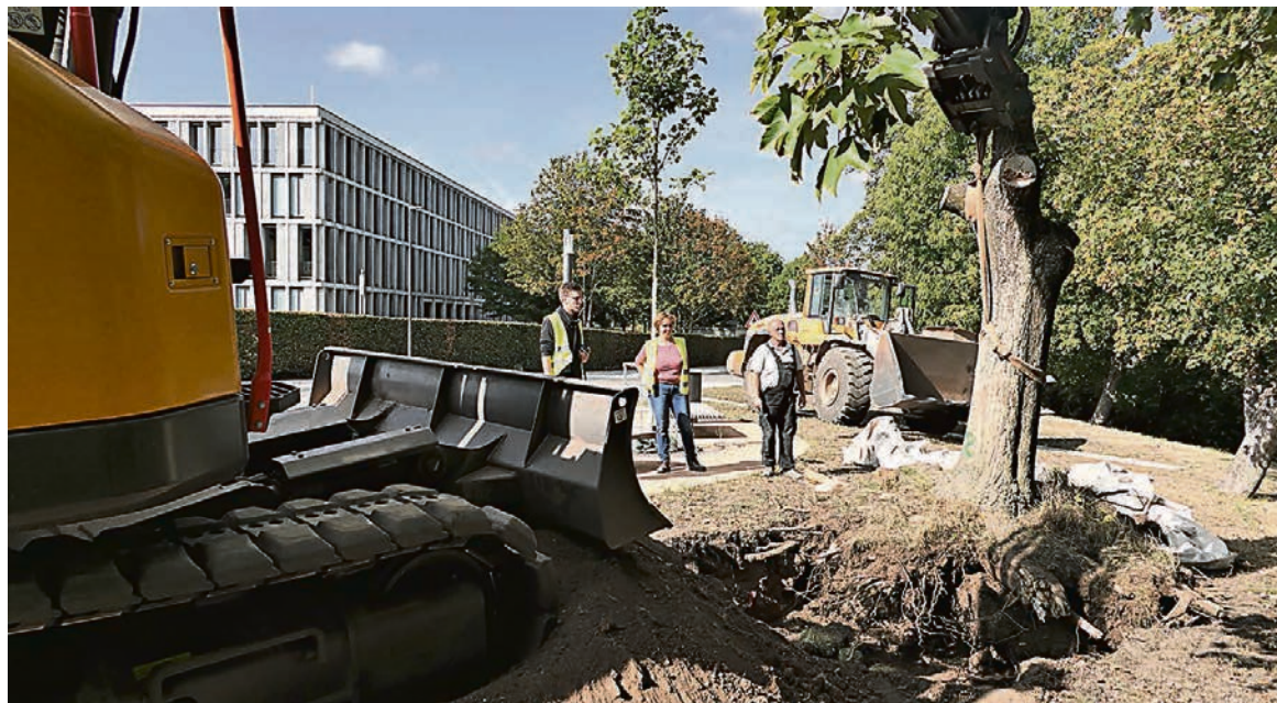
Mit großem Gerät wurde ein 30 cm tiefes Loch ausgehoben, um die Wurzeln abzulegen.

Auf dem Petersbergplateau musste der Baum fallen, weil sein Stamm hohl und die Wurzeln verfault waren.