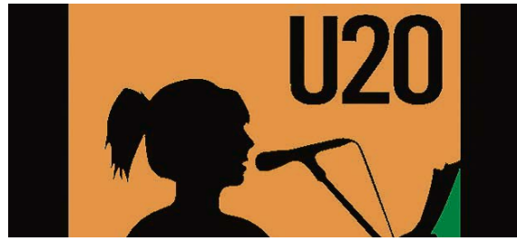
Grafik: Highslammer e.V.

Mit den Internationalen deutschsprachigen U-20 Poetry Slam Meisterschaften 2019 vom 2. bis 5. Oktober bringt der Highslammer e.V. die größte Jugendliteraturveranstaltung Europas und den Jahresabschluss aller U-20 Poetry Slams in deutschsprachigen Ländern nach Erfurt.