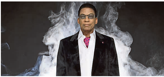
Ein Gast der Jazzmeile: Herbie Hancock (© Herbie Hancock)

Die Jazzmeile Thüringen ist ein einzigartiges Musikfestival, das sowohl Kontakt zu internationalen Trends im Jazz hält als auch den örtlichen Traditionen und Publikumsgeschmäckern verbunden bleibt. In diesem Jahr erlebt sie ihre 26. Auflage. Vom 22. September bis zum 12. Dezember werden in Erfurt und 19 anderen Thüringer Städten fast 200 Konzerte und zahlreiche Workshops stattfinden. Über 40 Konzerte davon können in Erfurt besucht werden. Höhepunkte der Jazzmeile in Erfurt sind die 11. Erfurter Jazzwanderung im Steigerwald am 22. September, die Konzerte „Nerly BigBand goes Brazil“ im Café Nerly am 14. und 15. Oktober, das Konzert von Paul Millns und Butch Coulter in der Thomaskirche am 9. November sowie der Auftritt von Herbie Hancock im Parksaal des Stadions am 1. Dezember.