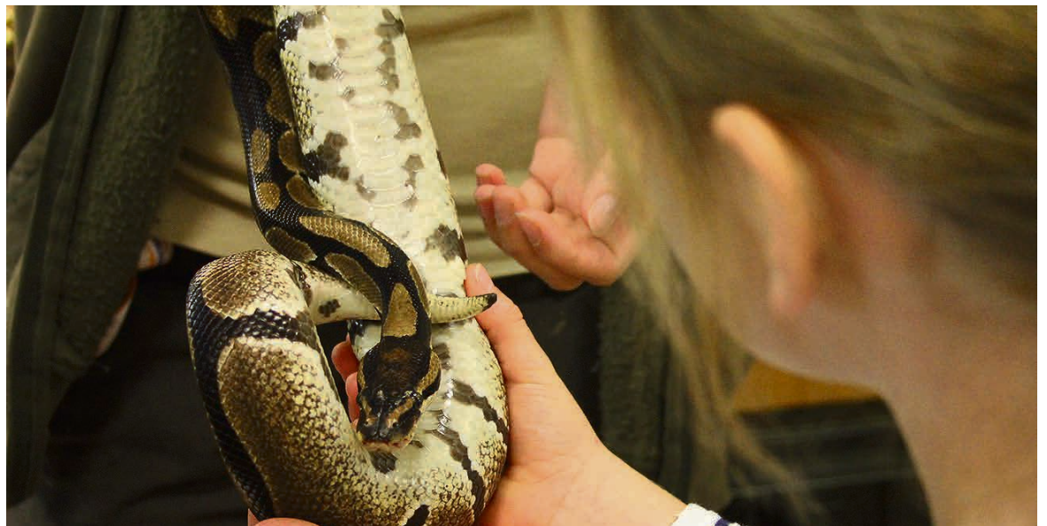
In der Zooschule kann man Schlangen ganz nah kommen. ■