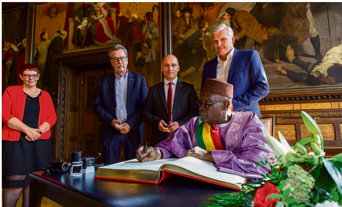
Katis Bürgermeister schrieb dankende Worte ins Goldene Buch der Stadt.

arbeit mit Kati sehr gut sei. Ouologuem schrieb anschließend ein langes Grußwort ins Goldene Buch. Seine Unterschrift beglaubigte er mit einem Stadtstempel. Laut Erfurter Protokoll war dies das erste Mal, dass im Goldenen Buch gestempelt wurde.