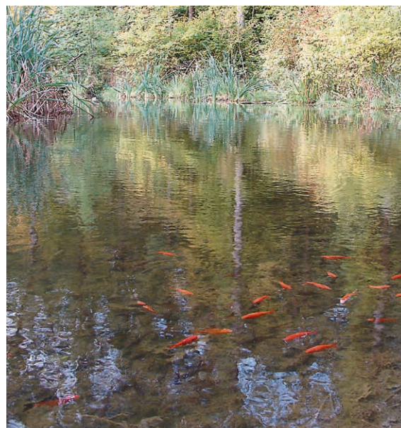
Artenreiche Teiche werden innerhalb kürzester Zeit zur Todeszone

Regelmäßig informiert das Umwelt- und Naturschutzamt über invasive Tier- und Pflanzenarten im Stadtgebiet Erfurt.