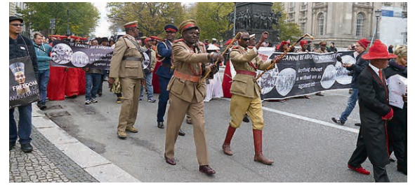
Demo von Herero und Nama in Berlin