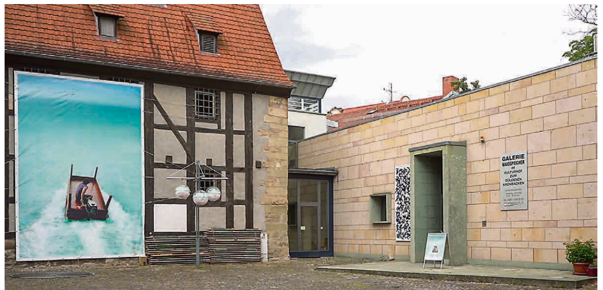
Die Ausstellung ZNE! in der Galerie Waidspeicher endet am 22. September.

Anlässlich seines neunzigsten Geburtstages kuratierte Timna Brauer, die älteste Tochter des Künstlers Arik Brauer, dessen Lebenswerk in der Kunsthalle in Erfurt. Ein Ausstellungsrundgang mit ihr ermöglicht am Donnerstag, dem 26. September, 19 Uhr, Einblicke in Brauers phantastische Bilderwelten. In der Konzertreihe „Connect“ gastieren am Freitag, dem 27. September, 19 Uhr, in der Kunsthalle die Weimarer Ensembles Miet+ und Ensemble via Nova. In diesem Konzert verbinden sich beide Ensembles zu einem interdisziplinären Spektakel. Der gemeinsam gestaltete Abend steht unter dem Titel „Neurosen“.