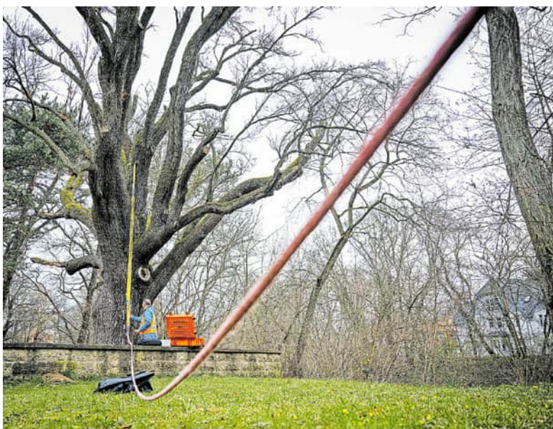
Ein Zugversuch simuliert eine starke Windlast.