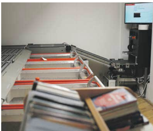
Die Sortieranlage arbeitet in der Hauptbibliothek im Verborgenen.

Die Einführung der RFID-Technik markiert einen entscheidenden Schritt zur Weiterentwicklung der Stadt- und Regionalbibliothek Erfurt zu einem zukunftsorientierten Bildungs- und Veranstal-