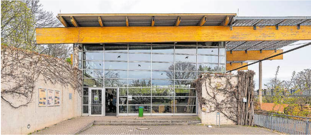
Priorität hat der Umbau des Nashornhauses. Das soll zukünftig auch die Zucht der Tiere ermöglichen.

Stadtrat beschließt drei Millionen Euro für die Neugestaltung der Anlagen und Bildungseinrichtungen