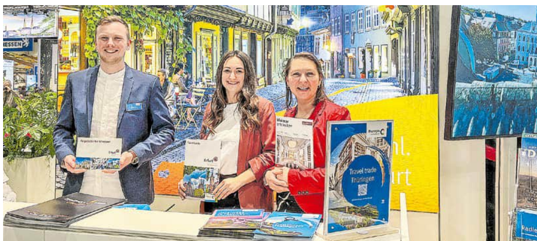
Auf der Internationalen Tourismusbörse wirbt die ETMG mit dem Motiv der Krämerbrücke.

zur Fiets en Wandelbeurs, um Aktiv-Interessierte für eine Tour auf dem Radfernweg Thüringer Städtekette zu begeistern. Der März begann mit der weltweit führenden Reisemesse, der Internationalen Tourismusbörse (ITB) in Berlin. Hier konnten zahlreiche nationale und internationale Reiseveranstalter sowie Journalisten von den Angeboten der Landeshauptstadt überzeugt werden. Ende März ging es dann zur Leipziger Buchmesse, um das kulturinteressierte Publikum für den Egapark, die zahlreichen Theaterangebote sowie die mittelalterliche Altstadt zu begeistern.