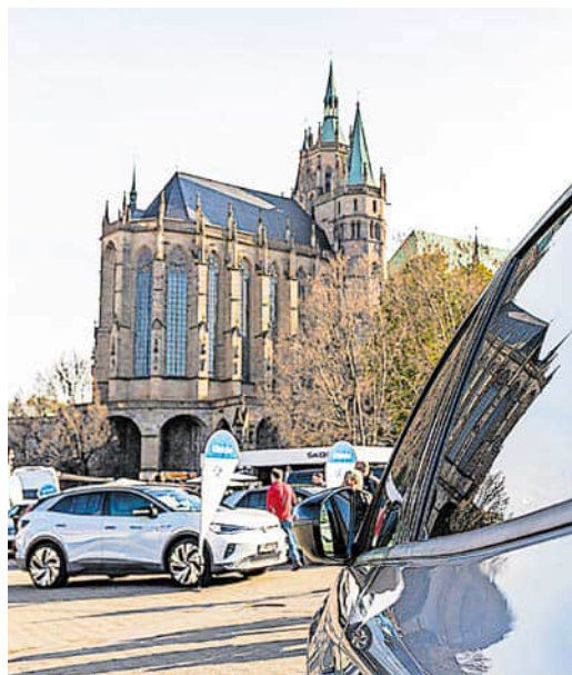
Zehn Autohäuser präsentieren auf dem Domplatz 24 verschiedene Automarken.

Am 20. und 21. April findet auf dem Domplatz die 33. Auflage des Erfurter Autofrühlings statt. Seit 1992 gibt es die Open-Air-Veranstaltung rund um das Thema Auto und Autozubehör. Alljährlich bietet sich die Möglichkeit, Modelle verschiedenster Hersteller auf dem Domplatz in Augenschein zu nehmen. In diesem Jahr präsentieren sich zehn Autohäuser