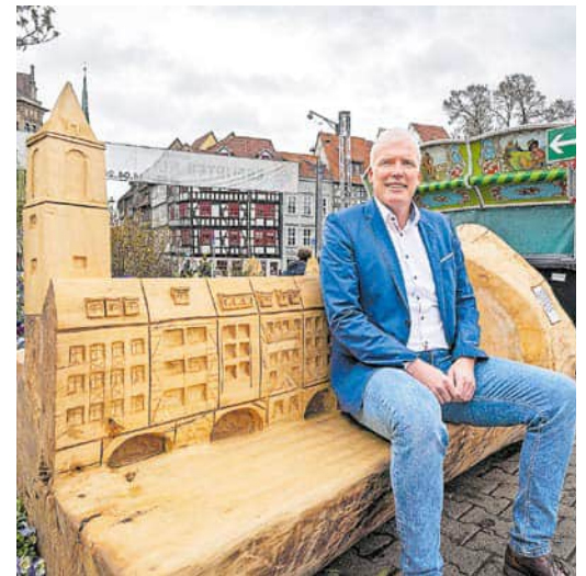
Oberbürgermeister Andreas Bausewein testet die neuen Bänke am Domplatzbeet.