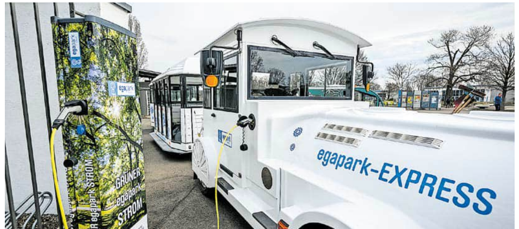
Neun Erdumrundungen im Jahr mit dem Egapark-Express – das wäre mit dem grünen Strom theoretisch möglich.

kraftwerks kann damit der Strombedarf gegenüber den Vorjahren etwa halbiert werden. Der Stromjahresverbrauch des Egaparks liegt zukünftig nur noch bei ca. 550.000 kWh“, zählt Egapark-Geschäftsführerin Kathrin Weiß die Vorzüge der neuen Energieerzeugungsanlage auf. Der elektrische Egapark-Express könnte mit der Energiemenge eines Jahres neun Mal die Erde umrunden.