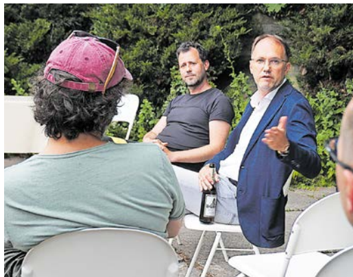
In entspannter Runde werden aktuelle Themen diskutiert.