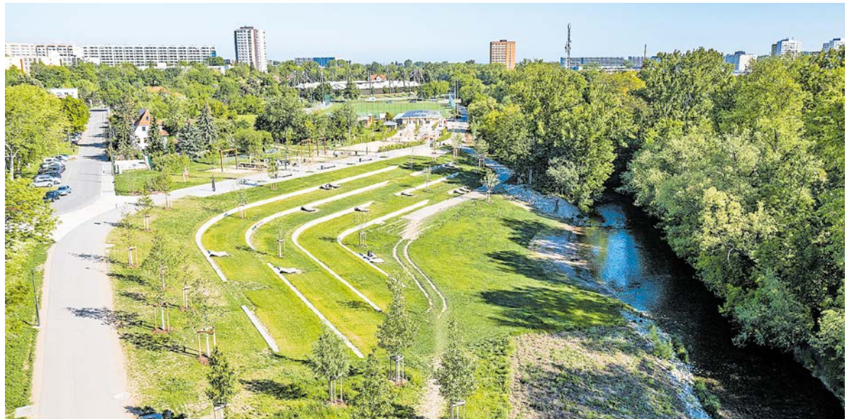
Die neugestaltete Geraaue ist beliebter Freizeitort – tagsüber, wie auch in den Abendstunden. Dann mitunter zum Unmut der Anwohner.

Für die einen ist es ihr abendliches Vergnügen, ein Treffen in der Gemeinschaft. Für die anderen ist es einfach nur Lärm. Probleme mit nächtlicher Ruhestörung im Umfeld von Parkanlagen hat jede große Stadt. Erfurt kennt sie auch. So macht beispielsweise der Brühler Garten als auch die Grünanlage am kleinen Venedig des Öfteren von sich reden, besser gesagt diejenigen, die dort abends Party machen. Anwohner fühlen sich von der Musik gestört oder kommen dadurch nicht in den Schlaf. Flaschen und Pizzakartons als Überbleibsel verschmutzen die Anlage noch zusätzlich. Doch, wie kann man hier Einhalt gebieten?