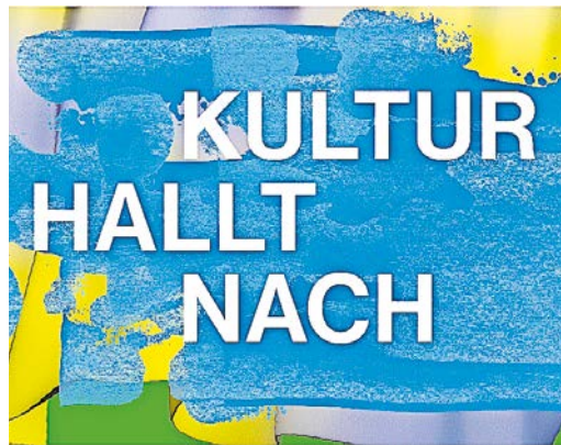
Das kulturelle Jahresthema 2022 lautet „Kultur haltt nach“.

Ganz unterschiedliche Vorhaben rund um das Thema Nachhaltigkeit werden im Rahmen des diesjährigen kulturellen Jahresthemas „Kultur haltt nach“ in Erfurt umgesetzt.