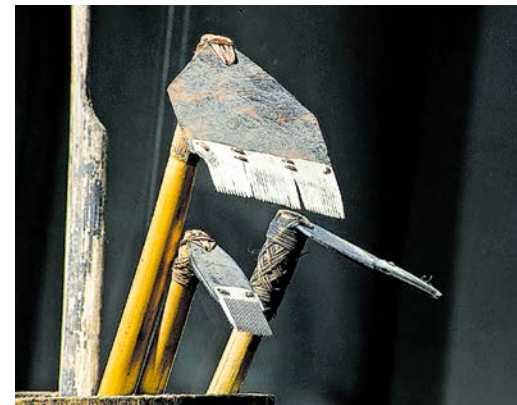
Traditionelles Tatauierset im Volkkundemuseum

Durch den Ankauf der Sammlung Knappe durch die Stadt Erfurt gelangte 1889 ein umfangreiches Tatauierset eines samoanischen Tatauiermeisters in den Erfurter Museumsbestand. Dieses Set nimmt das Museum für Volkskunde zum Anlass, ab dem 13. August 2022 im Rahmen der Sonderausstellung „tatau-tattoo: Südseetattoos zwischen Trend, Tabu und Tradition“ einen tieferen Einblick in die Welt der ozeanischen Tattoos zu geben.