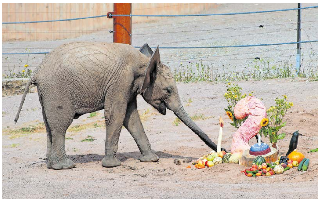
Elefantenmädchen Ayoka durfte sich über einen bunten Geburtstagstisch freuen.

Ihr Gewicht hat die Tochter von Chupa und Kibo inzwischen etwa verfünffacht. Zur Geburt wog Ayoka 114 kg und war 93 cm hoch. Heute bringt der kleine Wirbelwind stattliche 550 kg auf die Waage bei einer Körpergröße von 1,50 m.