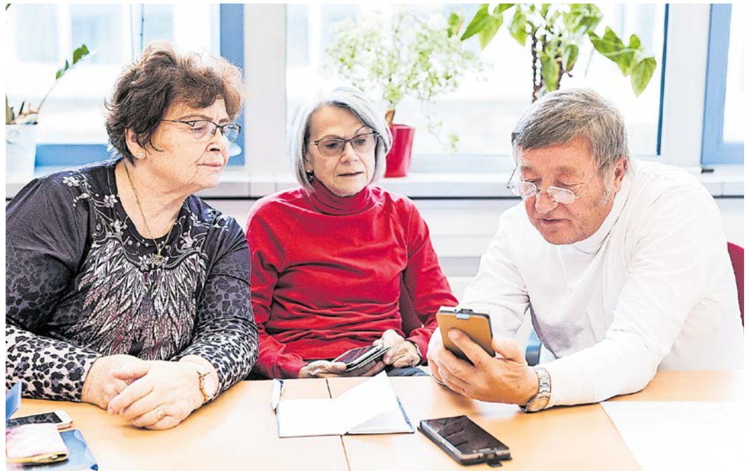
Ein Mentor von „Aktiv mit Medien“ erklärt zwei Seniorinnen den Umgang mit einem Smartphone.

Als zusätzliches Angebot will der Erfurter Seniorenbeirat mit dem Digital-Café die Möglichkeit bieten, in einer lockeren und offenen Atmosphäre zusammenzukommen und die digitale Welt nach und nach für sich zu entdecken. Dazu darf