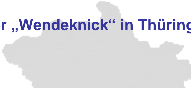
Anzahl Geburten in Thüringen